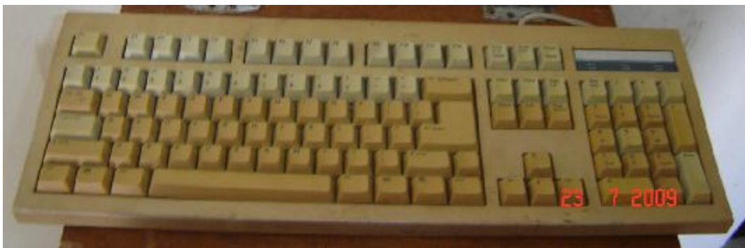
Lote 441 - TECLADO BRANCO (S.MARCA)