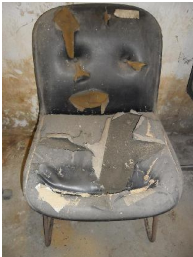
Lote 292 - SEM NÚMERO 90