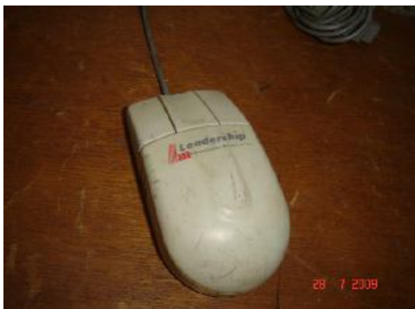
Lote 165 - MOUSE (LEADERSHIP)