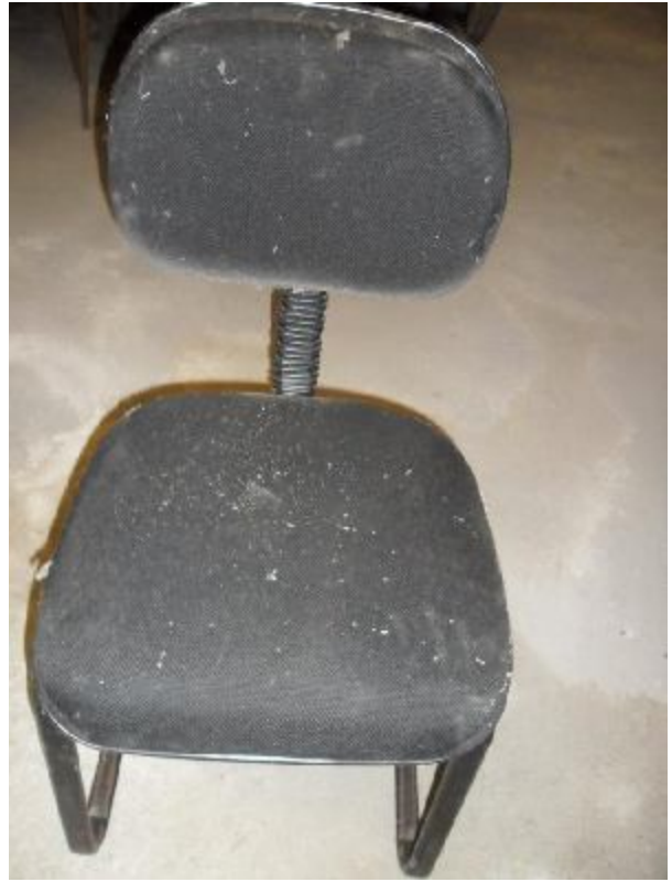
Lote 228 - SEM NÚMERO 016