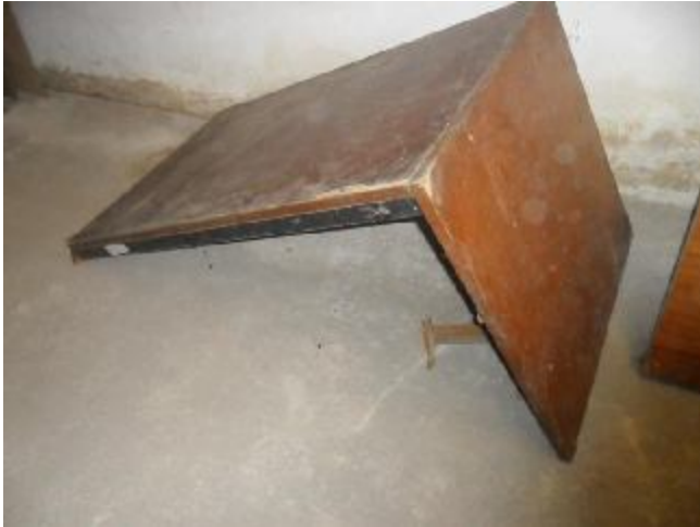
Lote 342 - SEM NÚMERO 141