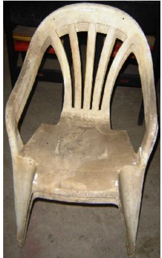
Lote 31 - 02 CADEIRAS PLASTIC, COM BRAÇOS