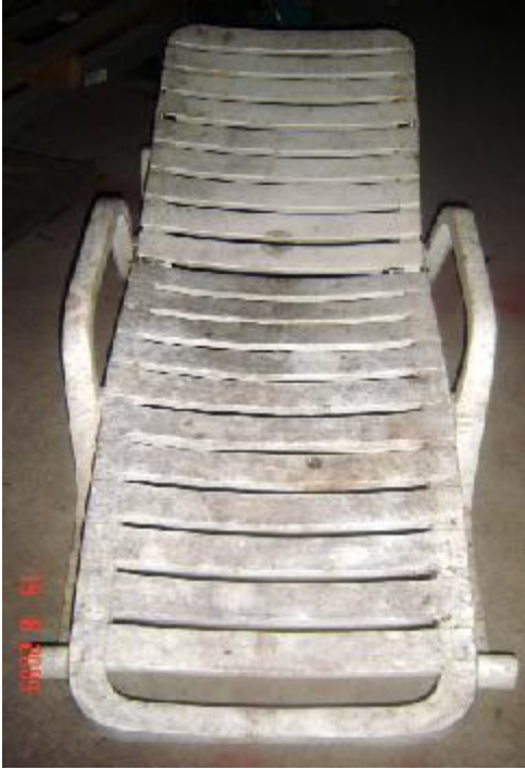
Lote 06 - Cardeira de Praia