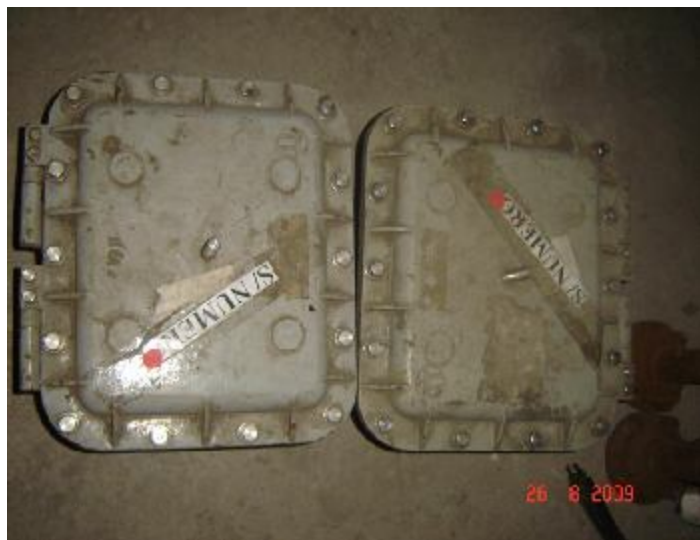
Lote 37 - 02 OBJETOS DE FERRO