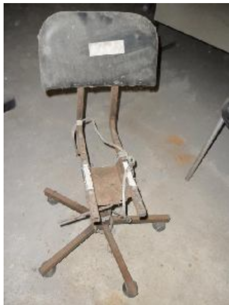
Lote 324 - SEM NÚMERO 123