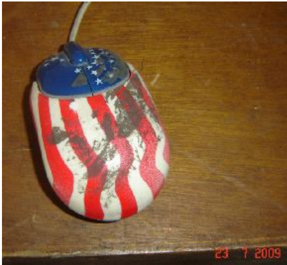
Lote 167 - MOUSE (PADRONIZADO EUA)