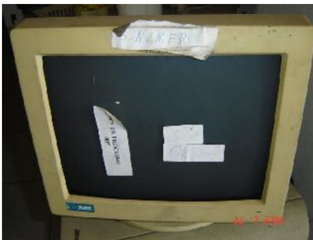
Lote 155 - MONITOR (VG ART)