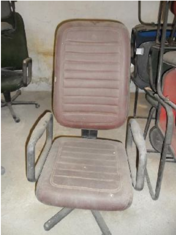
Lote 215 - SEM NÚMERO 003