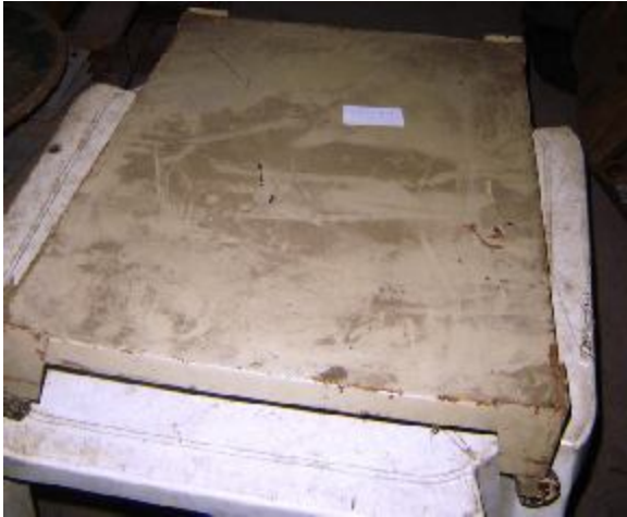
Lote 145 - MAQUINA TIPO CARRINHO