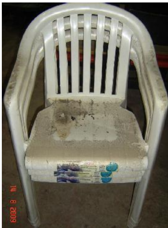
Lote 40 - 03 CADEIRAS (GROFILEX)