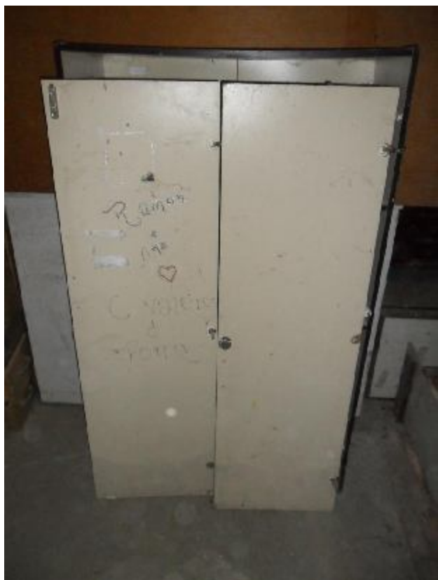
Lote 239 - SEM NÚMERO 037