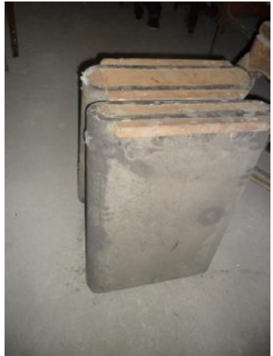
Lote 307 - SEM NÚMERO 105