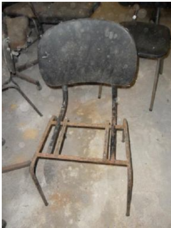
Lote 245 - SEM NÚMERO 043