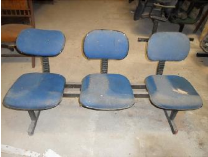
Lote 223 - SEM NÚMERO 012