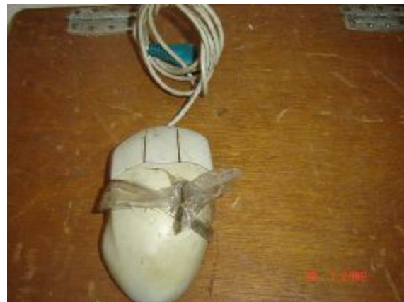
Lote 170 - MOUSE SEM MARCA