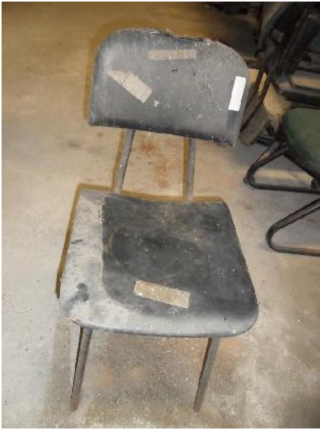
Lote 231 - SEM NÚMERO 019