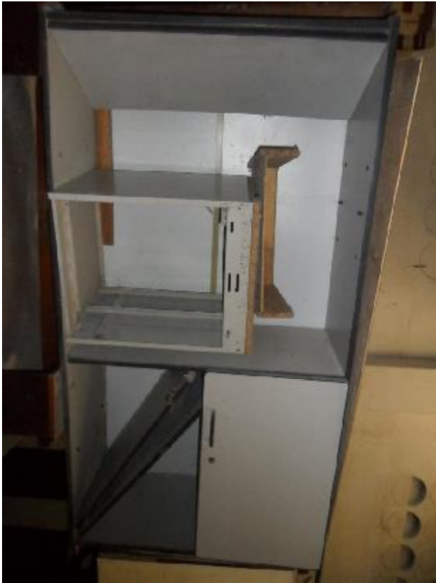
Lote 272 - SEM NÚMERO 70