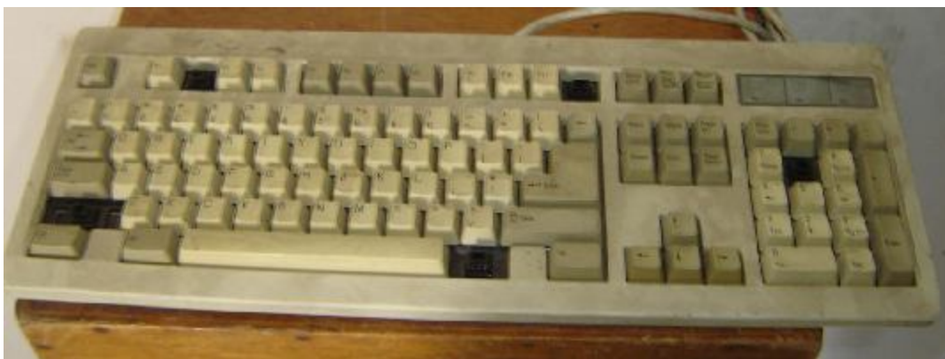
Lote 442 - TECLADO