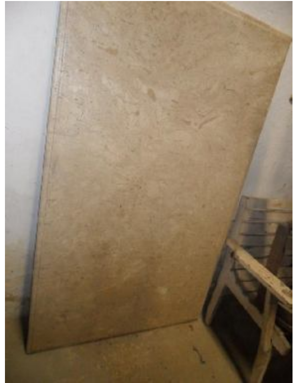
Lote 341 - SEM NÚMERO 140