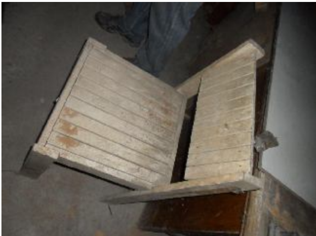
Lote 407 - SEM NÚMERO 207