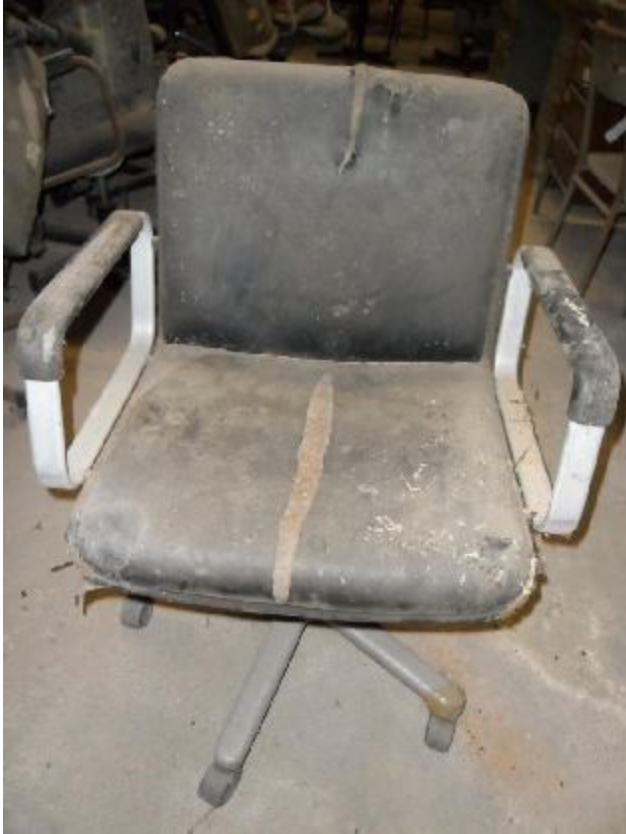
Lote 326 - SEM NÚMERO 125