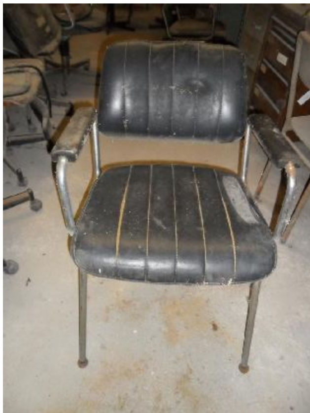
Lote 278 - SEM NÚMERO 76