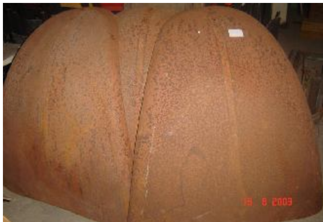
Lote 42 - 03 CAPUZ DE FUSCA ENFERRUJADOS