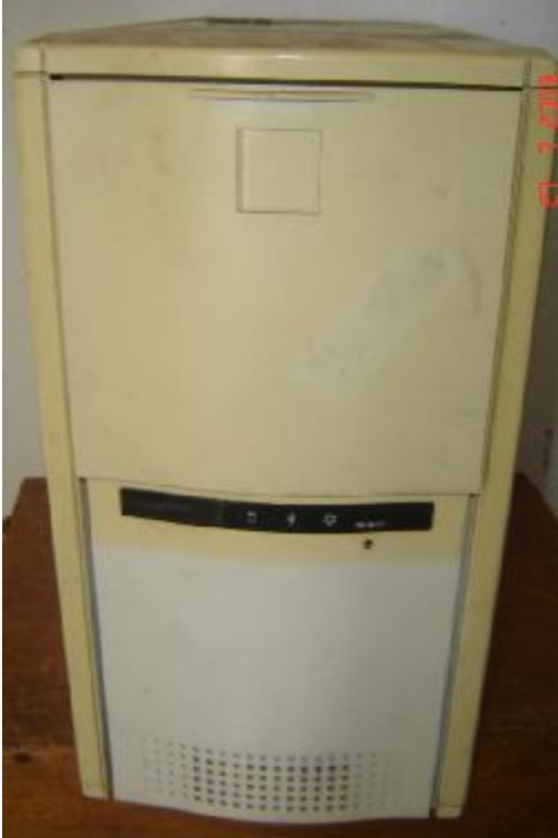
Lote 103 - CPU (S. MARCA)