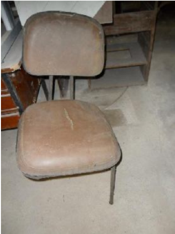
Lote 264 - SEM NÚMERO 062