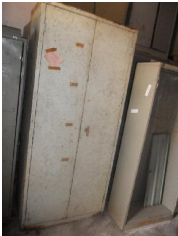
Lote 357 - SEM NÚMERO 156