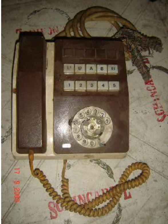
Lote 73 - APARELHO TELEFÔNICO