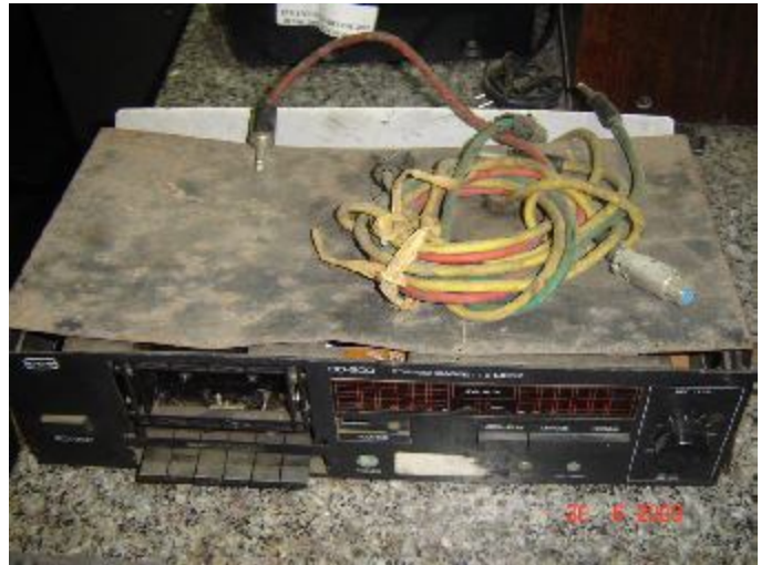
Lote 113 - DECK (CCE)