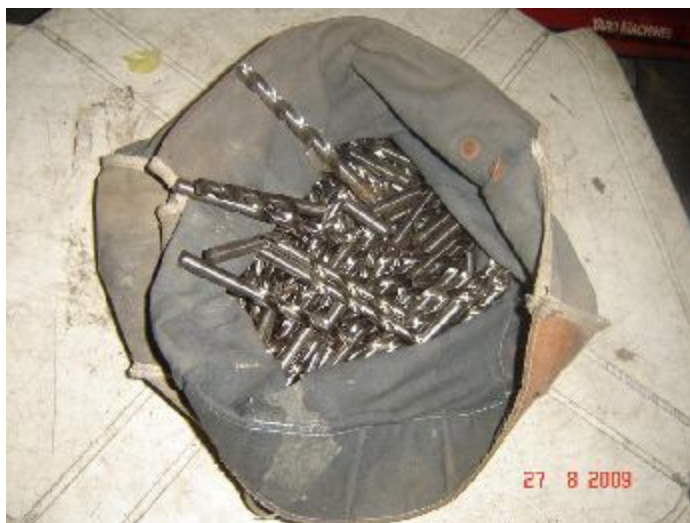
Lote 61 - 183 BROCAS DE FURADEIRA