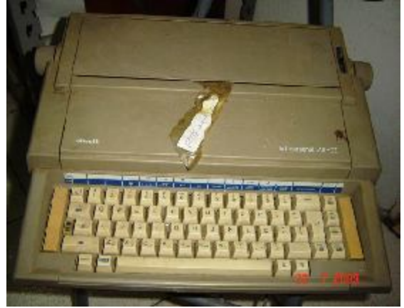
Lote 140 - MAQUINA DE ESCREVER (OLIVETTI - ET PERSONAL 510 II)