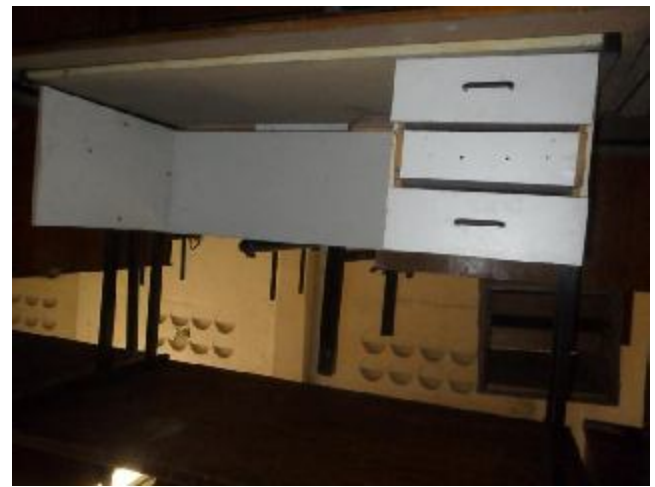
Lote 337 - SEM NÚMERO 136