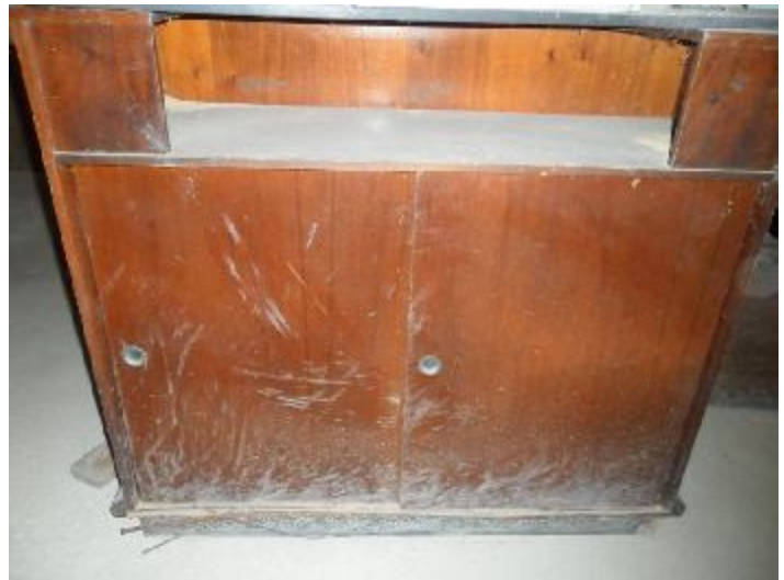
Lote 267 - SEM NÚMERO 065