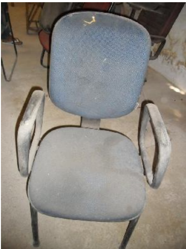
Lote 217 - SEM NÚMERO 005