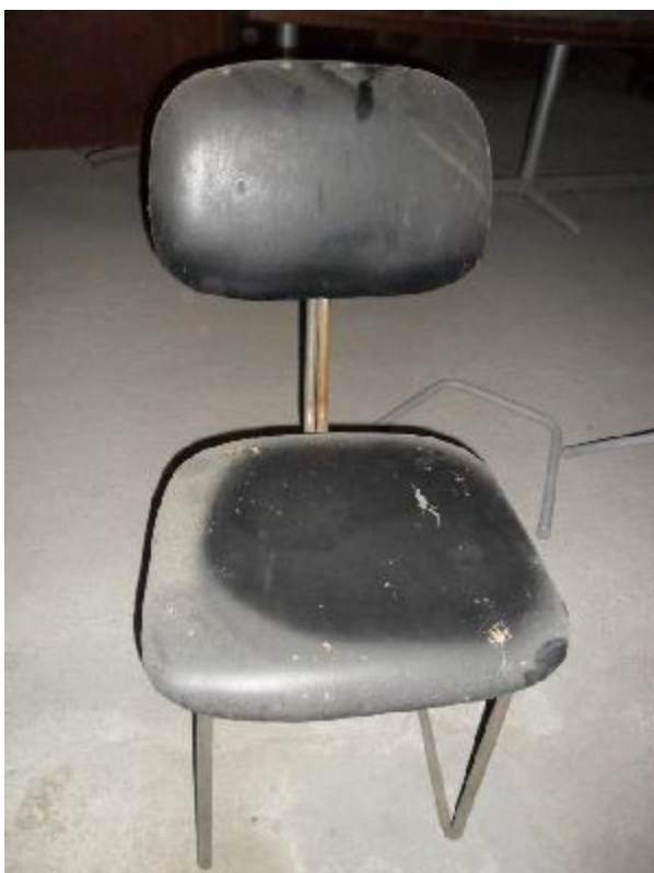
Lote 221 - SEM NÚMERO 009