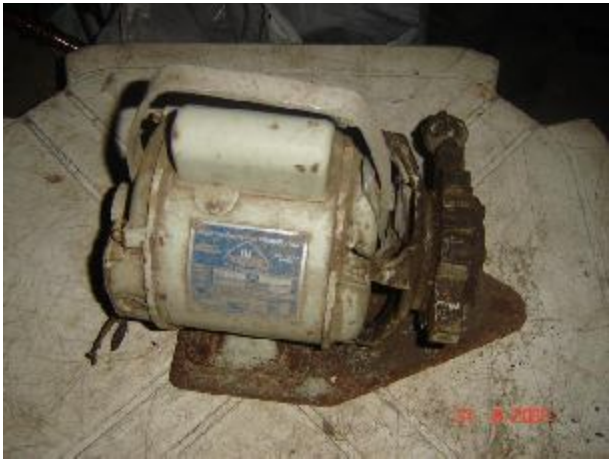
Lote 157 - MOTOR DE BOMBA DE VÁCUO