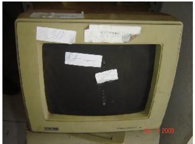
Lote 154 - MONITOR (VIDEOCOMPO VDC 901)