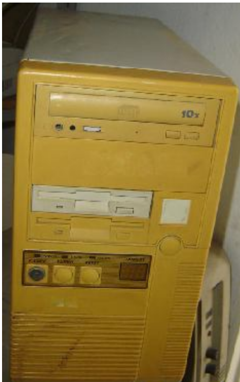
Lote 105 - CPU (VERTICAL)