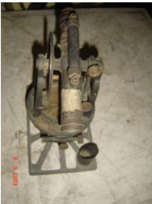
Lote 149 - MICROSCÓPIO