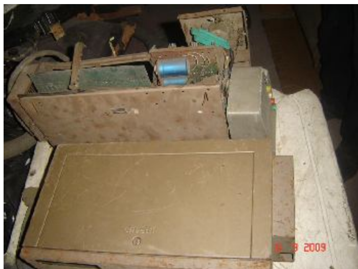
Lote 39 - 02 OBJETOS MARCA OLIVETTI