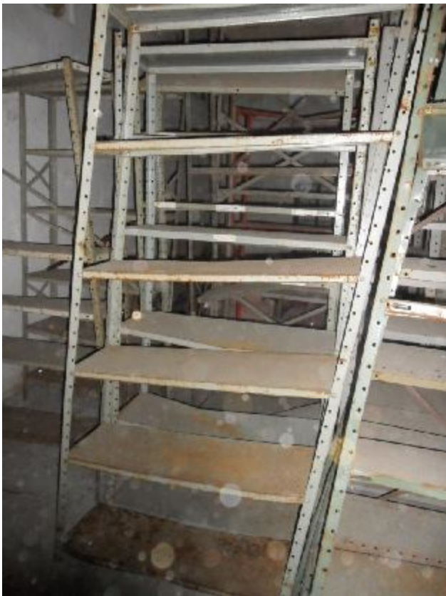
Lote 411 - SEM NÚMERO 211