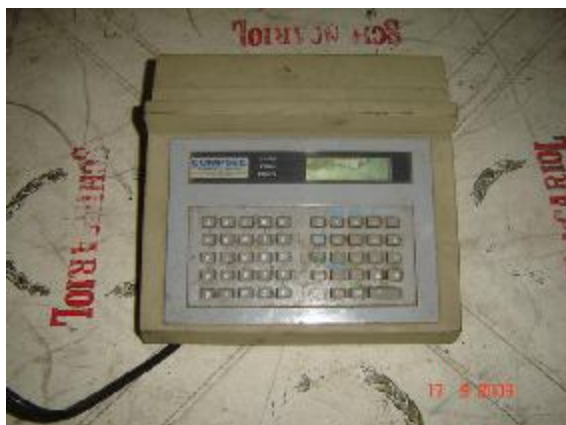
Lote 68 - APARELHO COMPSE