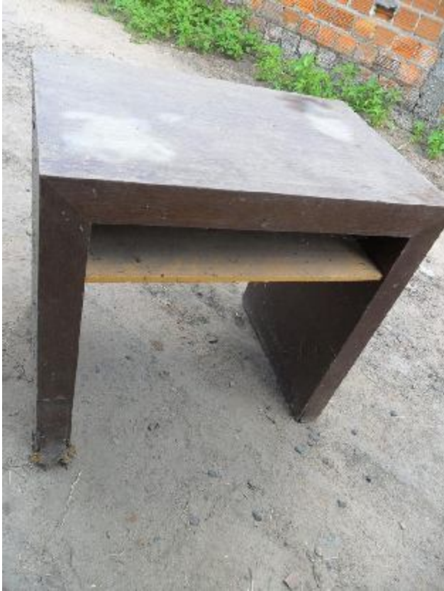
Lote 352 - SEM NÚMERO 151