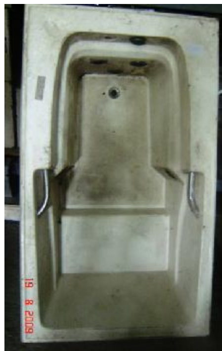
Lote 03 - Banheira