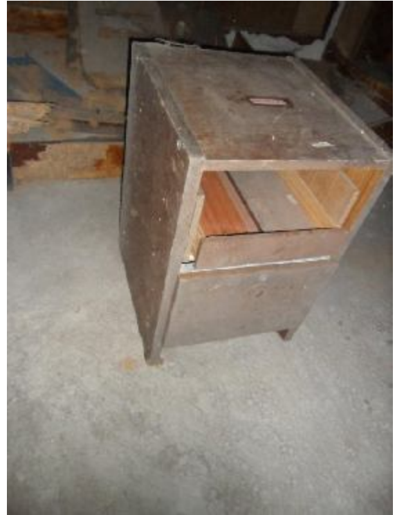
Lote 368- SEM NÚMERO 166