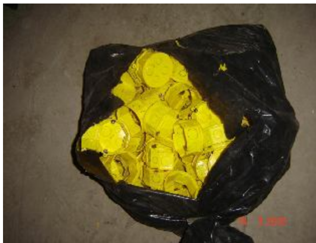
Lote 84 - CAIXAS DE PLASTICO - AMARELAS