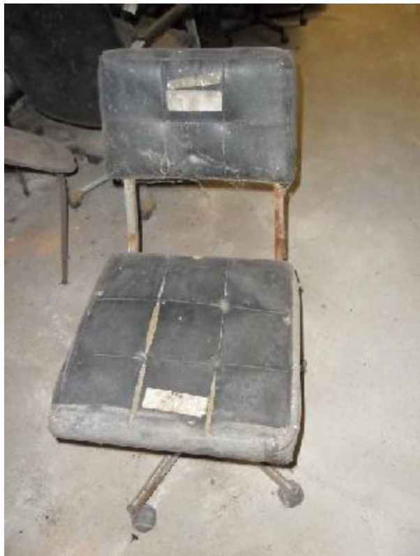
Lote 260 - SEM NÚMERO 058