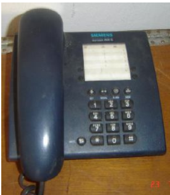
Lote 449 - TELEFONE (SIEMENS AZUL)