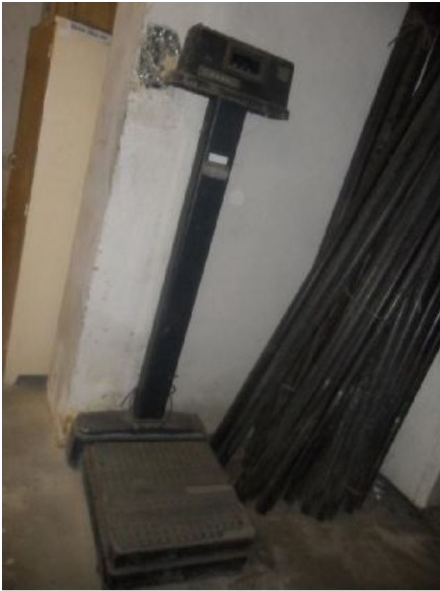
Lote 296 - SEM NÚMERO 94