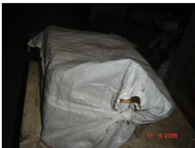
Lote 196 - OBJETOS NATALINOS