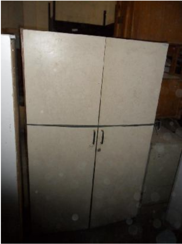
Lote 241 - SEM NÚMERO 039