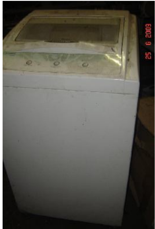
Lote 134 - LAVADORA (BRASTEMP)