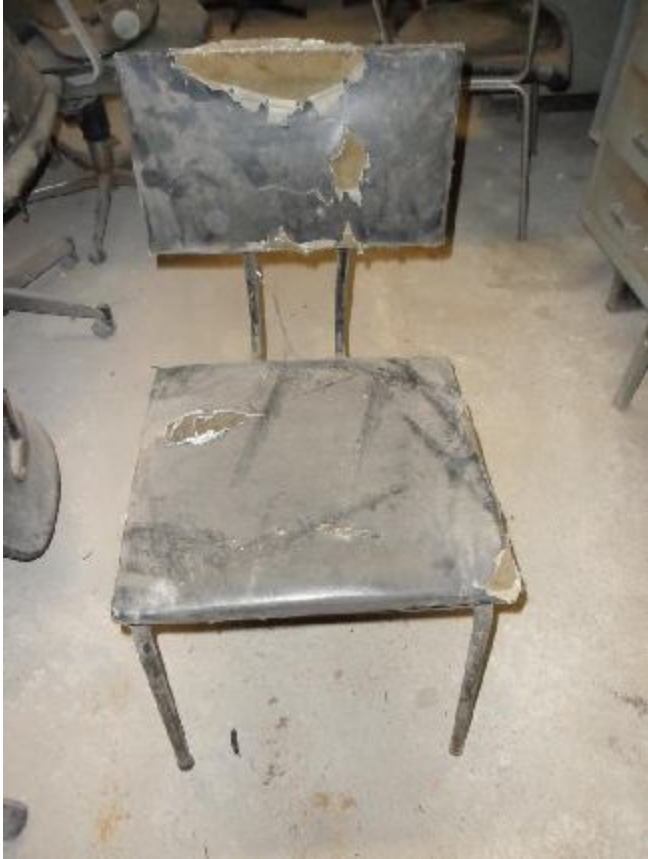
Lote 280 - SEM NÚMERO 78