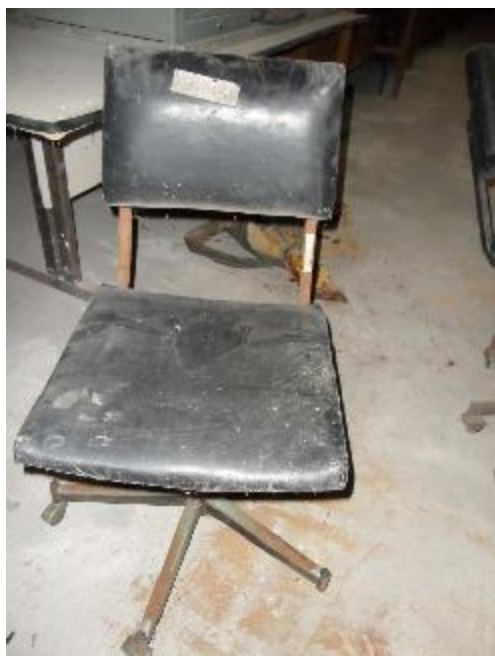
Lote 248 - SEM NÚMERO 046