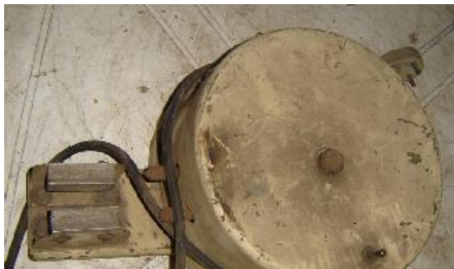
Lote 187 - OBJETO