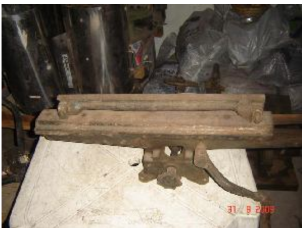
Lote 137 - MAQUINA DE CORTE