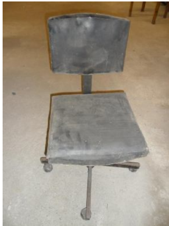
Lote 83 - CADEIRA PRETA