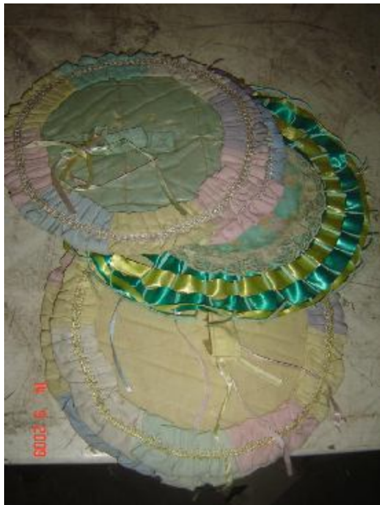
Lote 193 - OBJETOS ENFEITADOS