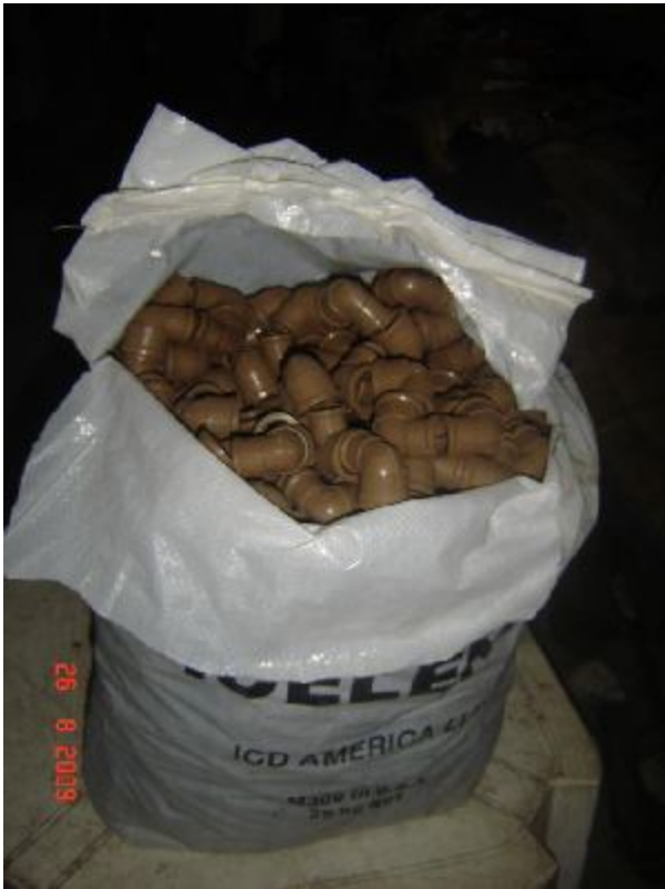
Lote 133 - JOELHOS (CANOS)