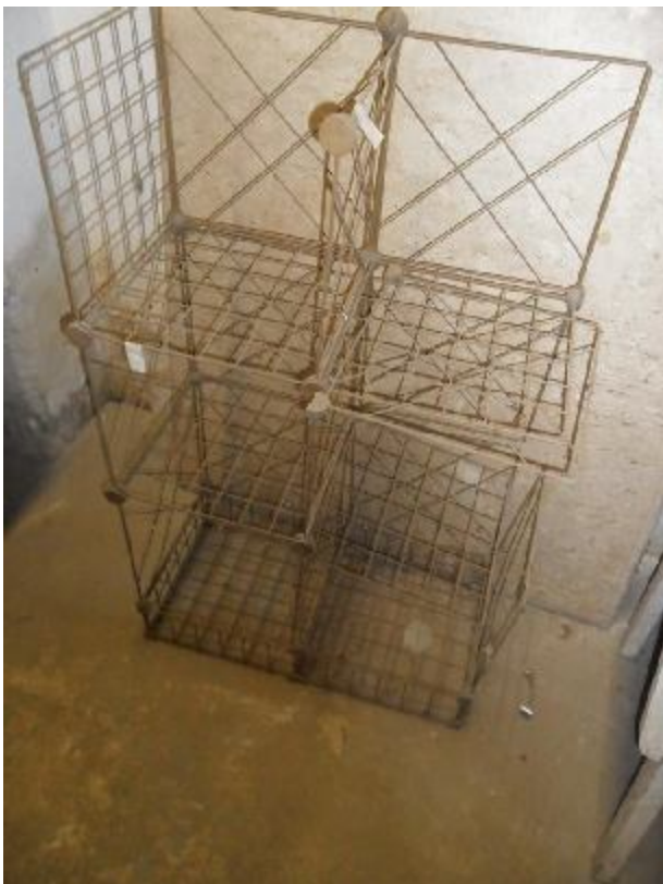
Lote 342 - SEM NÚMERO 141