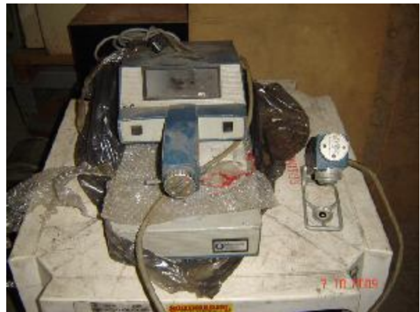
Lote 136 - MAQUINA (MACBETH)