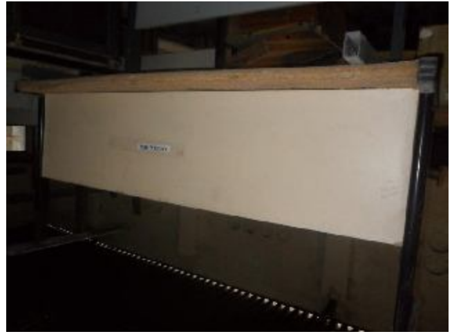
Lote 301 - SEM NÚMERO 99