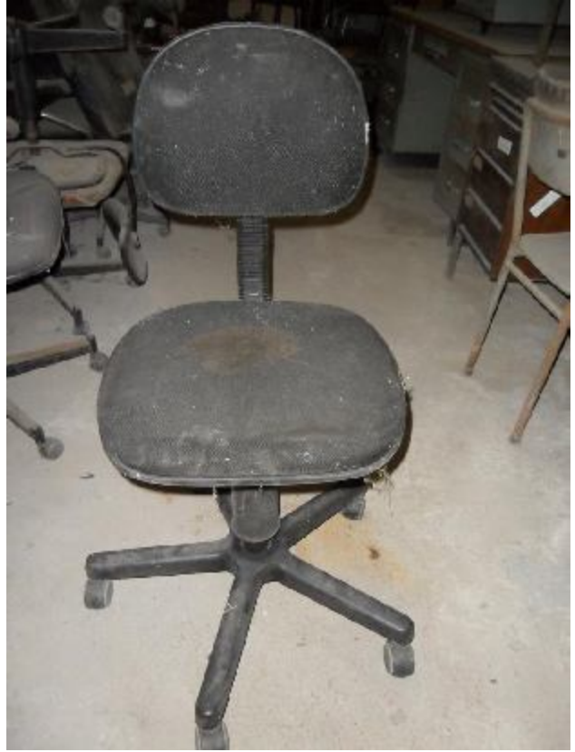
Lote 327 - SEM NÚMERO 126