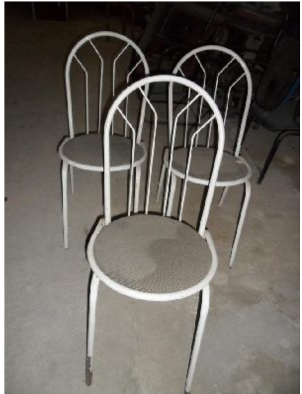
Lote 220 - SEM NÚMERO 008