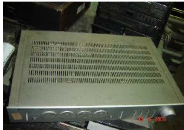
Lote 66 - APARELHO AMPLIFIER(KENWOOD)