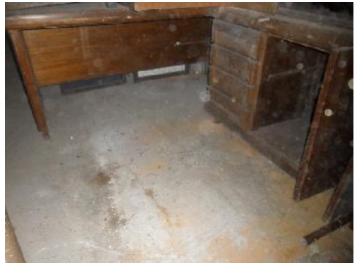
Lote 382 - SEM NÚMERO 181