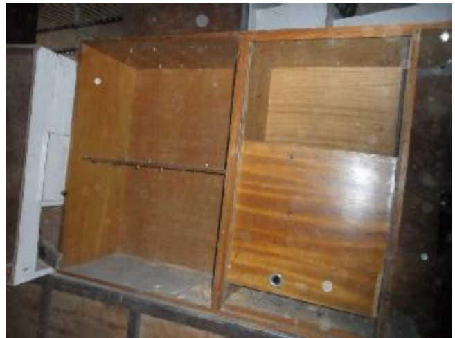
Lote 376 - SEM NÚMERO 175