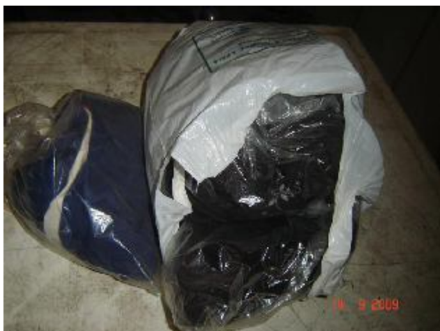
Lote 212 - ROUPAS VARIADAS