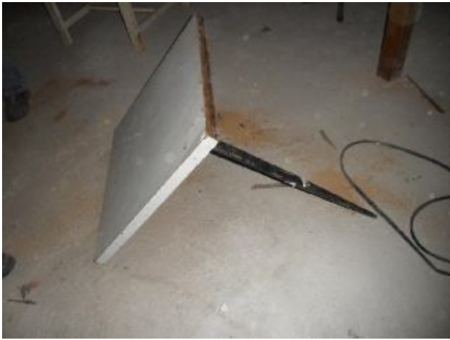
Lote 387 - SEM NÚMERO 187