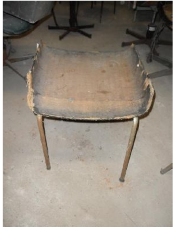
Lote 331 - SEM NÚMERO 130