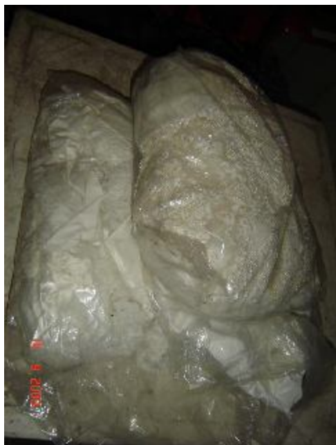
Lote 213 - ROUPAS VARIADAS