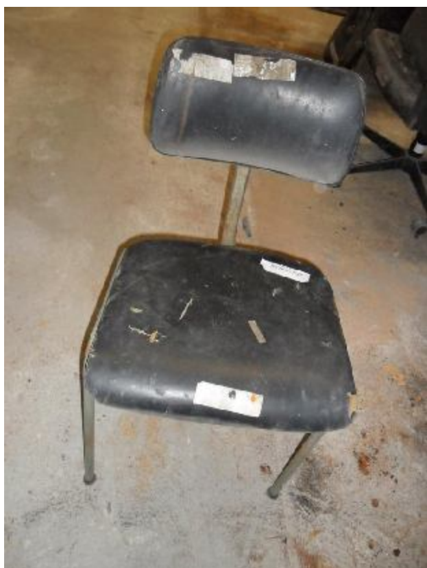
Lote 235 - SEM NÚMERO 033