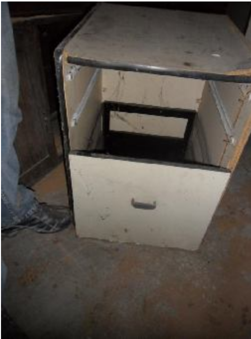
Lote 381 - SEM NÚMERO 180