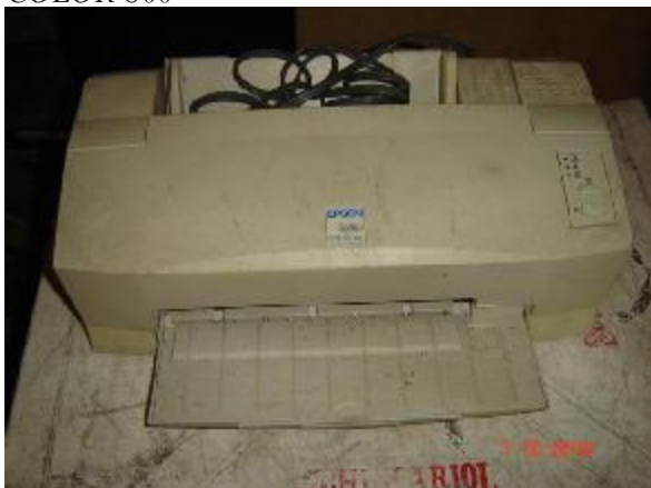
Lote 127 - IMPRESSORA (EPSON STYLUS) COLOR 800