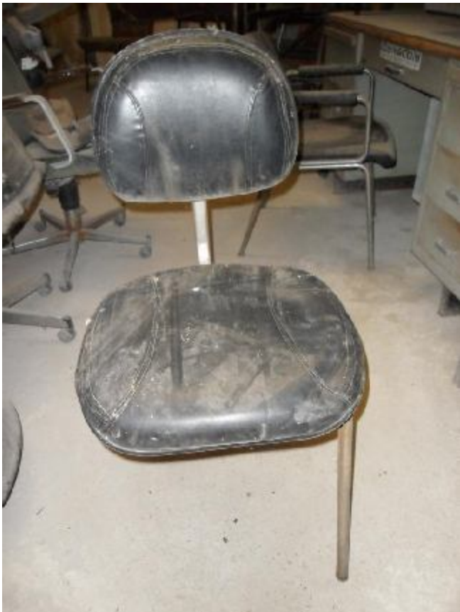
Lote 282 - SEM NÚMERO 80