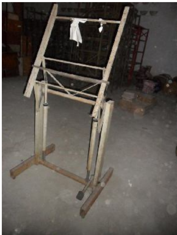
Lote 358 - SEM NÚMERO 157