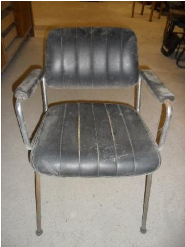
Lote 219 - SEM NÚMERO 007