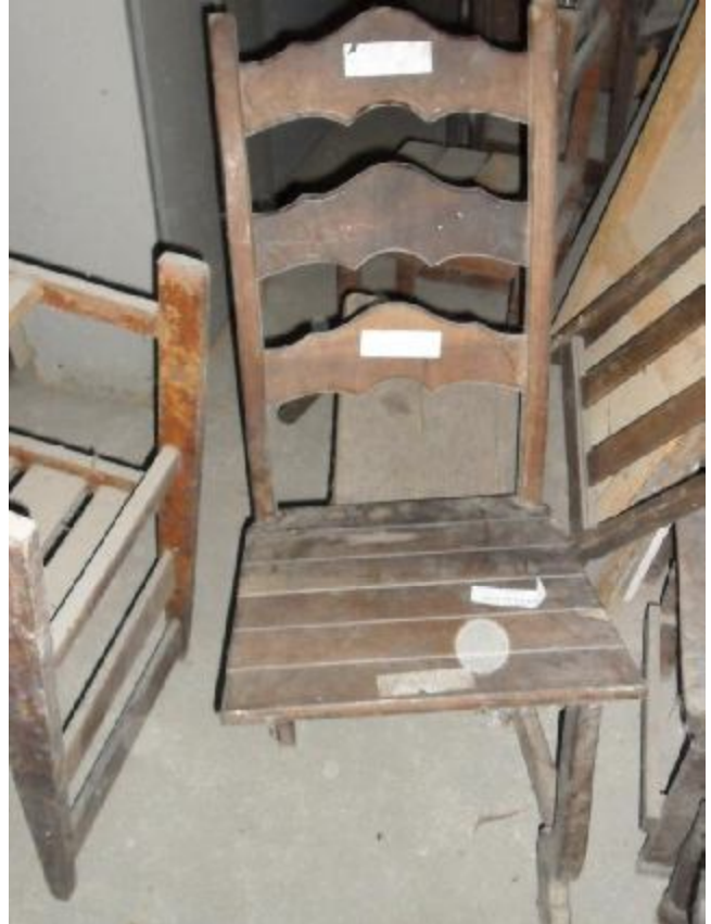
Lote 345 - SEM NÚMERO 144