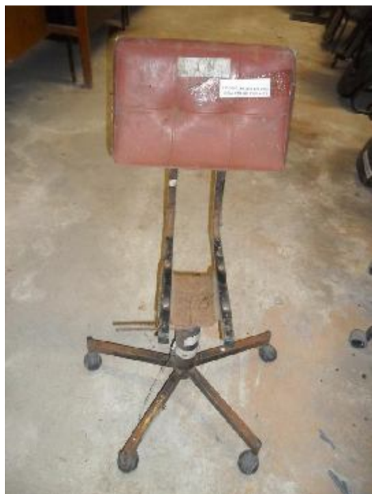
Lote 294 - SEM NÚMERO 92