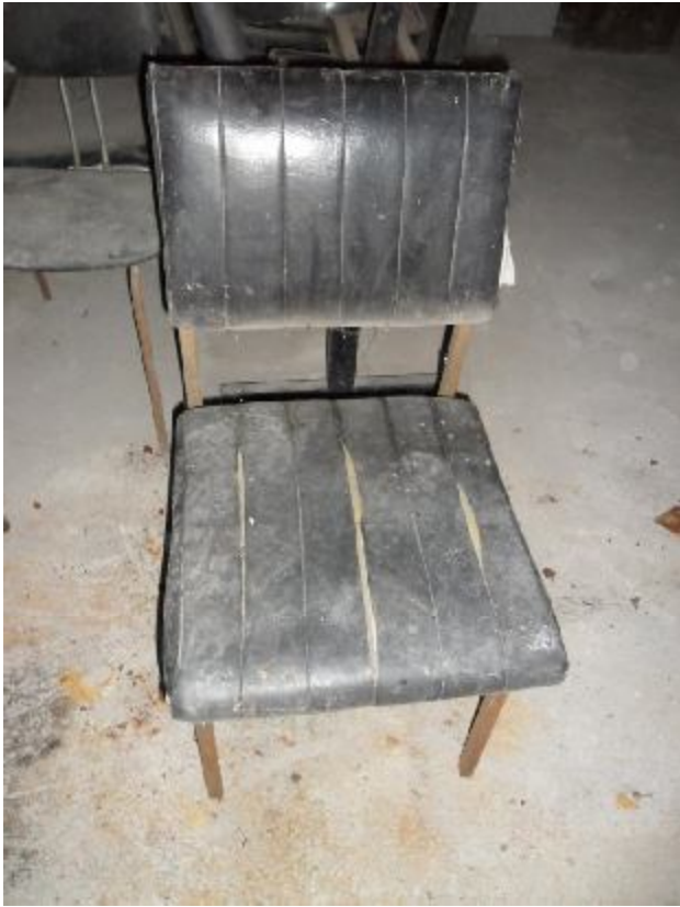
Lote 239 - SEM NÚMERO 027