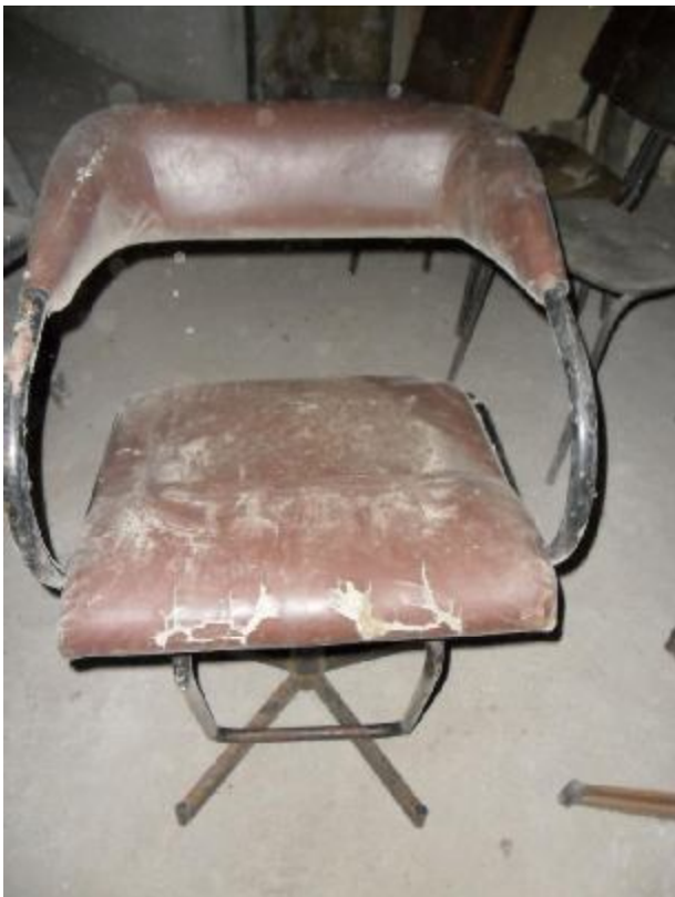
Lote 270 - SEM NÚMERO 68