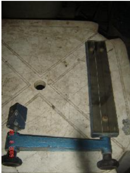
Lote 20 - Peça SN°