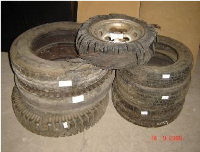
Lote 51 - 07 PNEUS