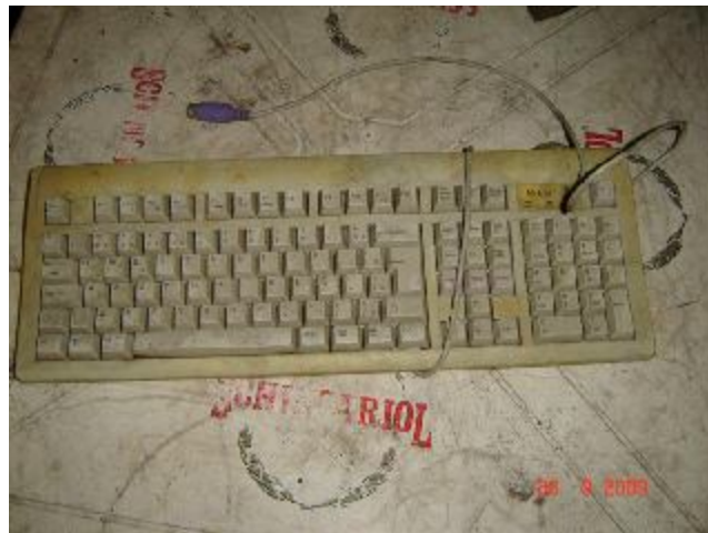
Lote 431 - TECLADO (S.MARCA )