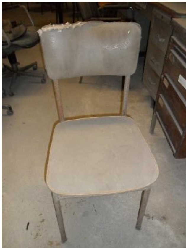
Lote 277 - SEM NÚMERO 75