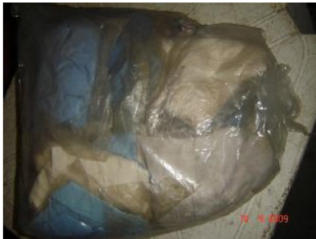
Lote 210 - ROUPAS VARIADAS