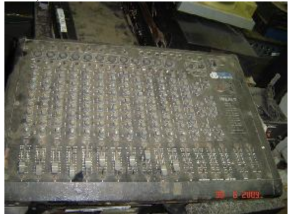
Lote 146 - MESA DE SOM (DB TECHNOLOGIES)