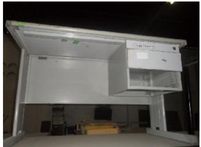
Lote 303 - SEM NÚMERO 101