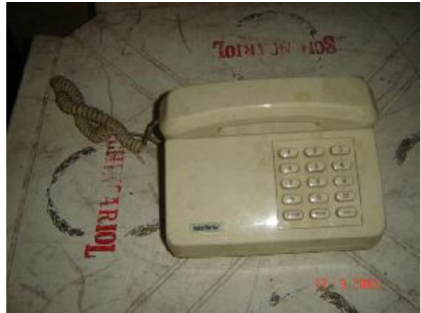
Lote 75 - APARELHO TELEFÔNICO - INTELBRAS