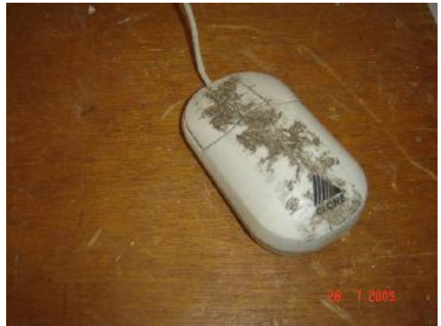
Lote 174 - MOUSE, (CLONE)