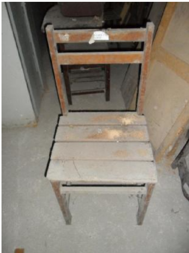
Lote 349 - SEM NÚMERO 148