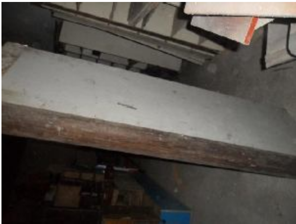
Lote 369 - SEM NÚMERO 167