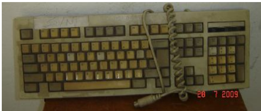
Lote 445 - TECLADO, (GATEWAY 2000)