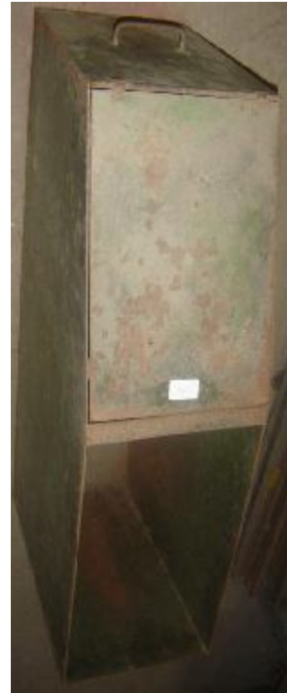
Lote 19 - Objeto Tipo Gaveta de Ferro