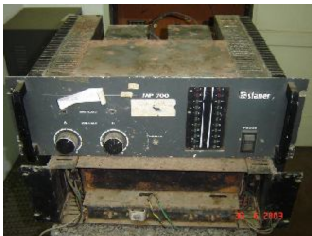
Lote 185 - MP 700 (STANER)