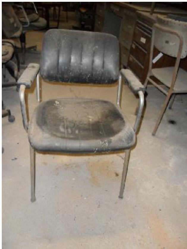
Lote 276 - SEM NÚMERO 74