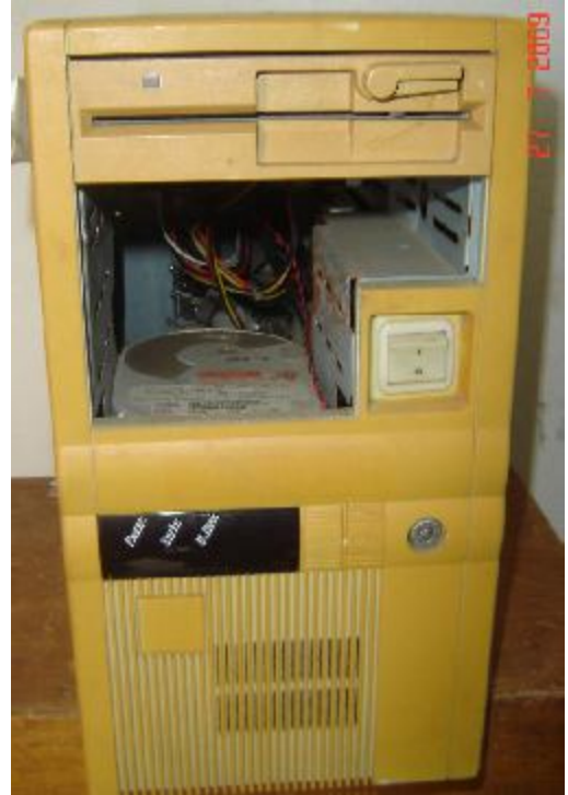
Lote 104 - CPU (SEM MARCA)