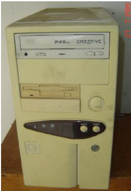
Lote 97 - CPU (CREATIVE)