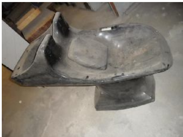
Lote 235 - SEM NÚMERO 033