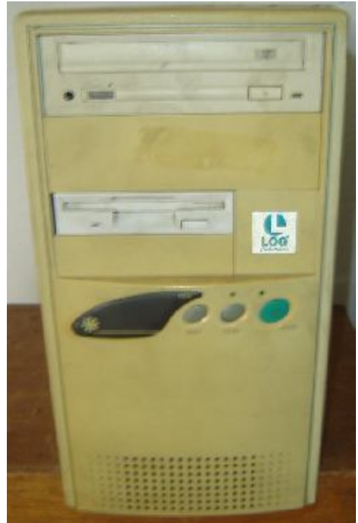
Lote 100 - CPU (LOG)