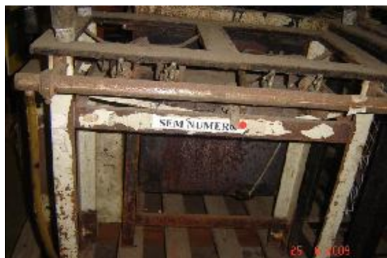
Lote 122 - FOGÃO(---)