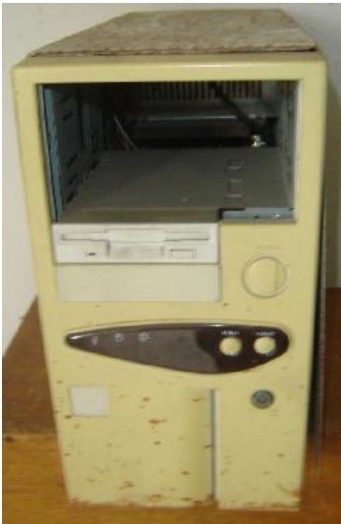
Lote 101 - CPU (NEW INFORMÁTICA)