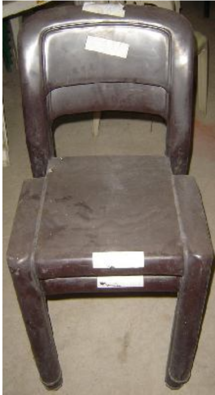
Lote 30 - 02 CADEIRAS PLASIC. (MARRON)