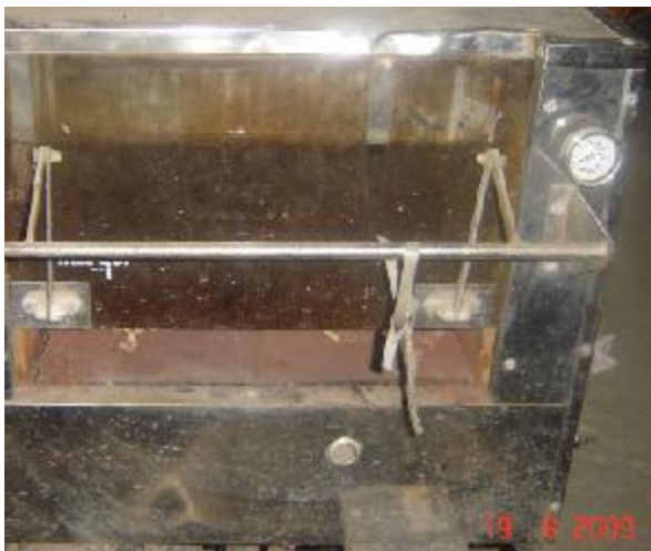
Lote 12 - Forno