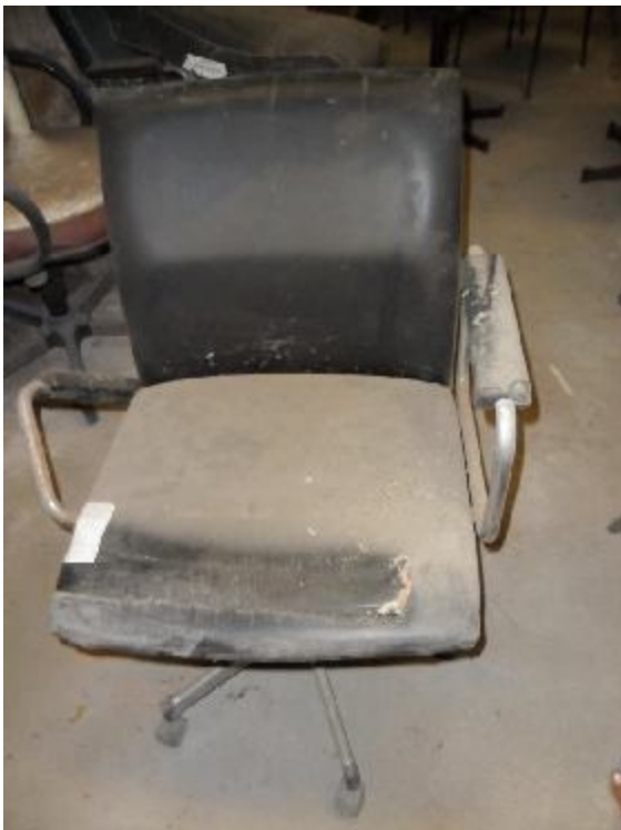
Lote 332 - SEM NÚMERO 131