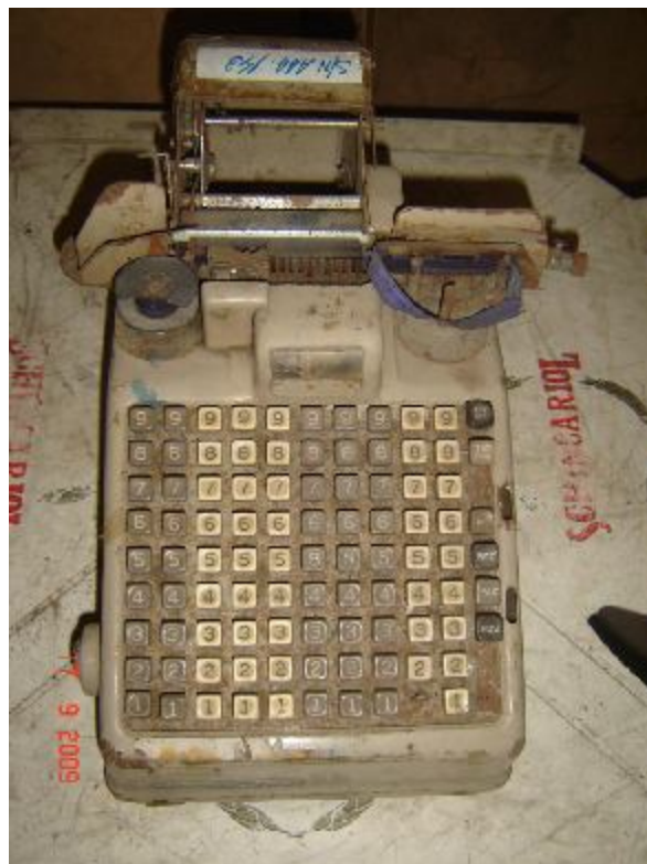
Lote 89 - CALCULADORA ELETRÔNICA (OLIVETTI)