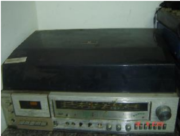
Lote 204 - RADIOLA (SONY)