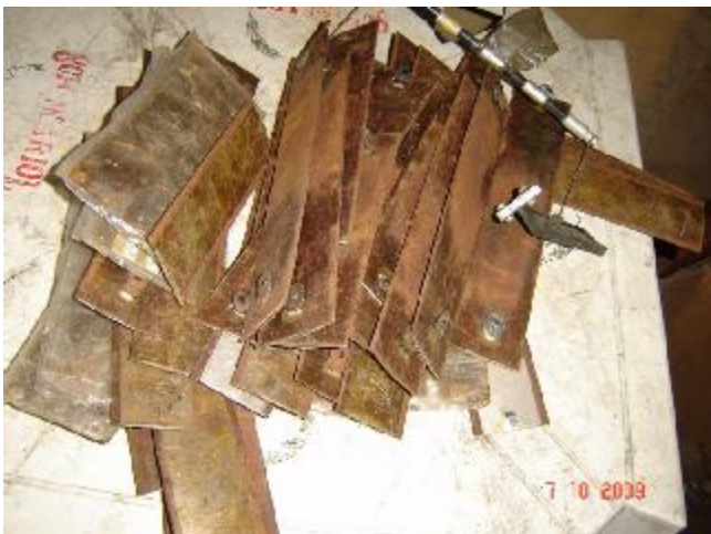
Lote 202 - PEÇAS DE FERROS -DIVERSOS