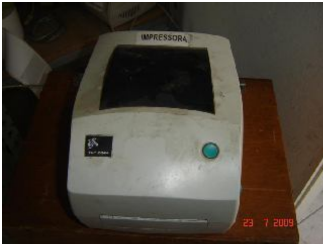
Lote 130 - IMPRESSORA (TLP 2844)