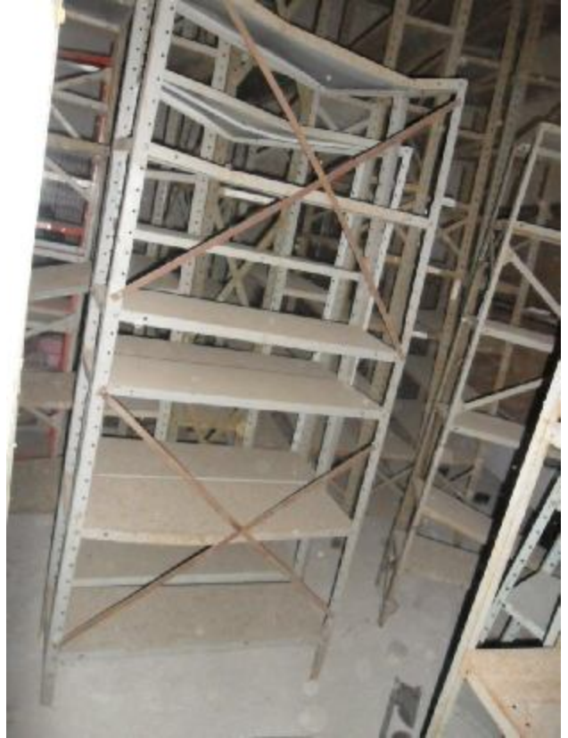
Lote 410 - SEM NÚMERO 210