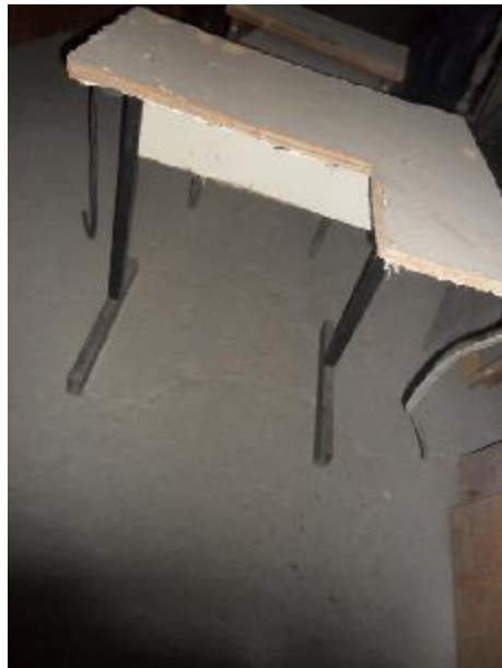
Lote 322 - SEM NÚMERO 121