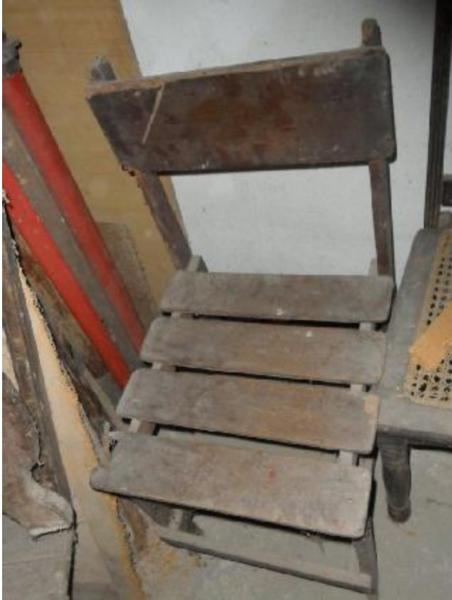
Lote 344 - SEM NÚMERO 143