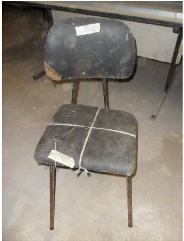
Lote 232 - SEM NÚMERO 020