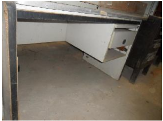
Lote 335 - SEM NÚMERO 134