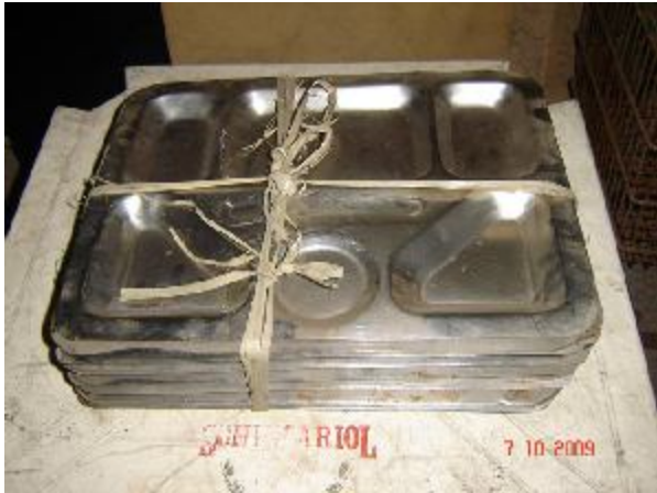
Lote 78 - BANDEJAS