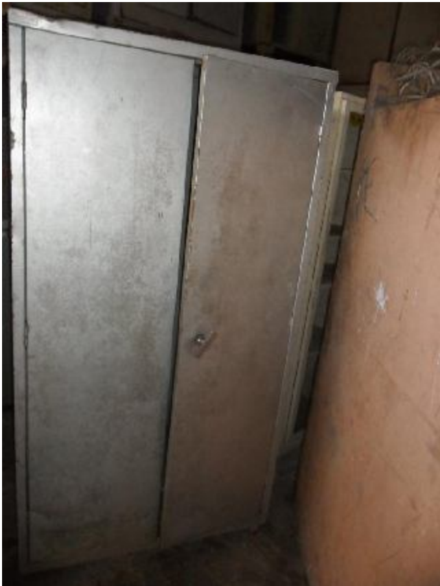
Lote 354 - SEM NÚMERO 153