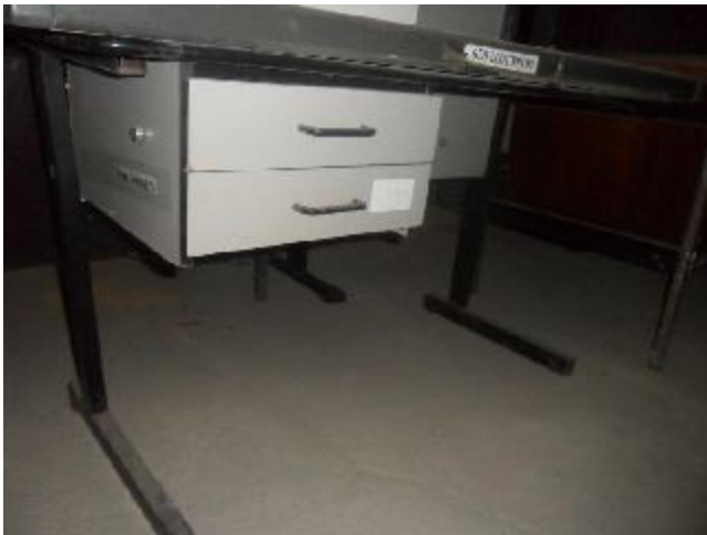
Lote 302 - SEM NÚMERO 100