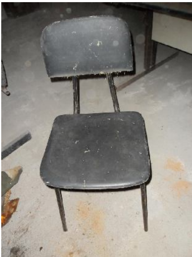
Lote 237 - SEM NÚMERO 025