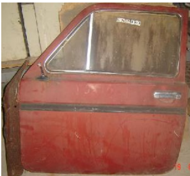
Lote 24 - Porta de automóvel, vermelha