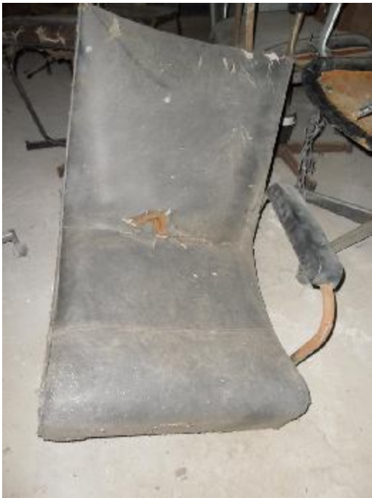
Lote 318 - SEM NÚMERO 117