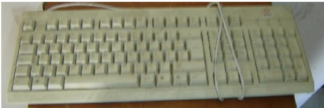
Lote 440 - TECLADO AMARELADO (S.MARCA)