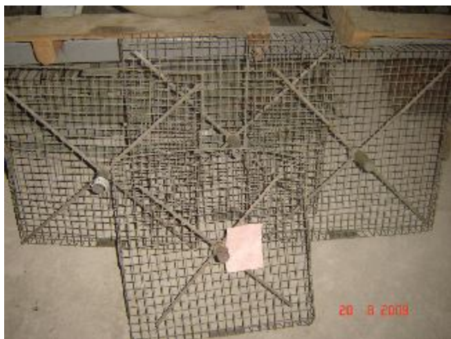
Lote 44 - 04 GRADES