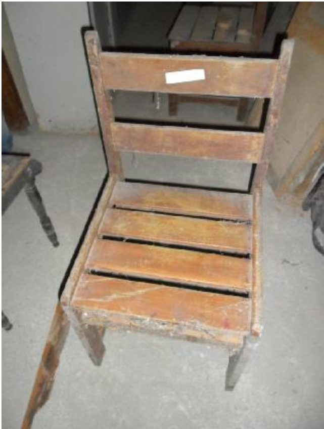
Lote 346 - SEM NÚMERO 145