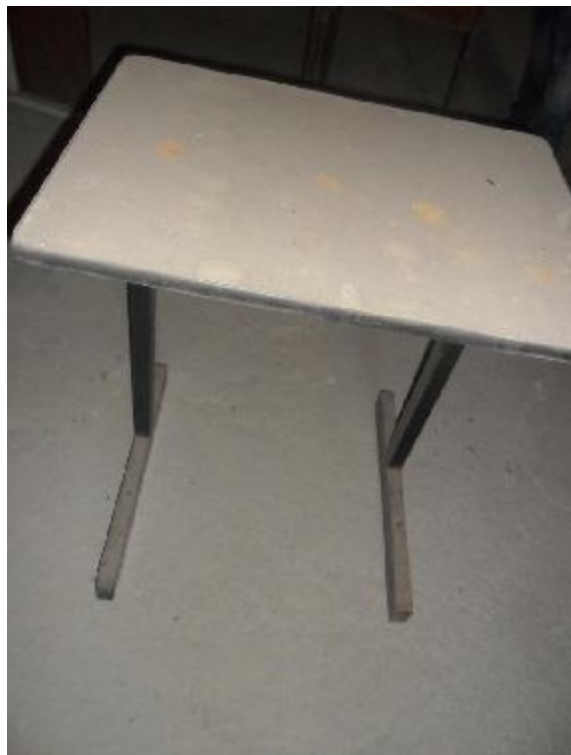
Lote 311 - SEM NÚMERO 109