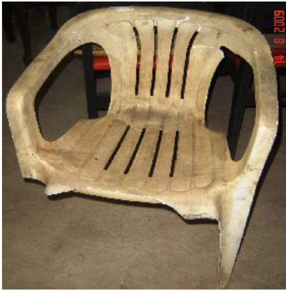
Lote 09- Cadeira Plastica Perna Quebrada