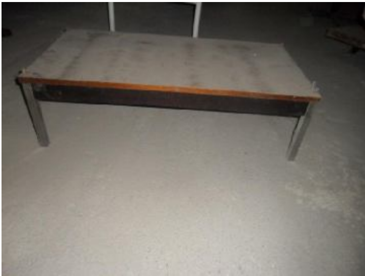
Lote 308 - SEM NÚMERO 106