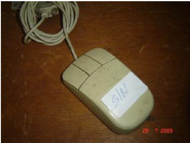
Lote 181 - MOUSE, (S.MARCA)