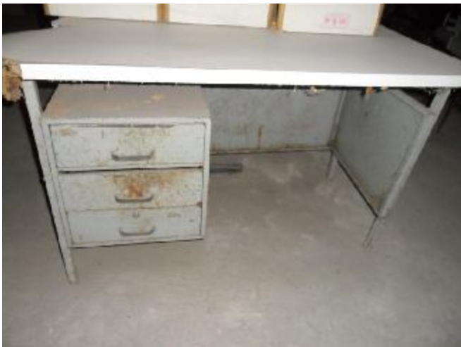
Lote 266 - SEM NÚMERO 064