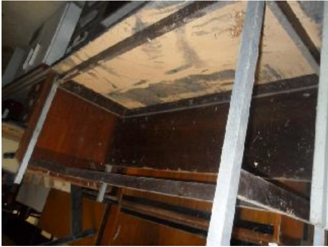
Lote 334 - SEM NÚMERO 133