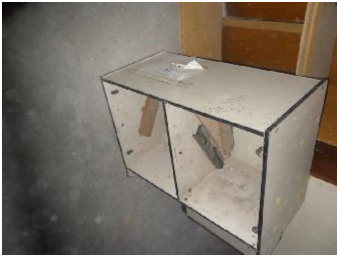
Lote 367 - SEM NÚMERO 165