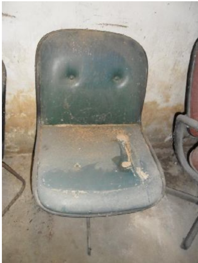
Lote 293 - SEM NÚMERO 91