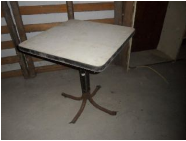
Lote 385 - SEM NÚMERO 185