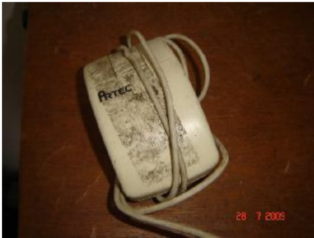
Lote 173 - MOUSE, (ARTEC)