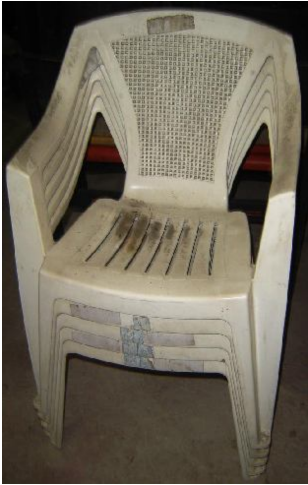
Lote 46 - 05 CADEIRAS BRANCAS PLASTIC.