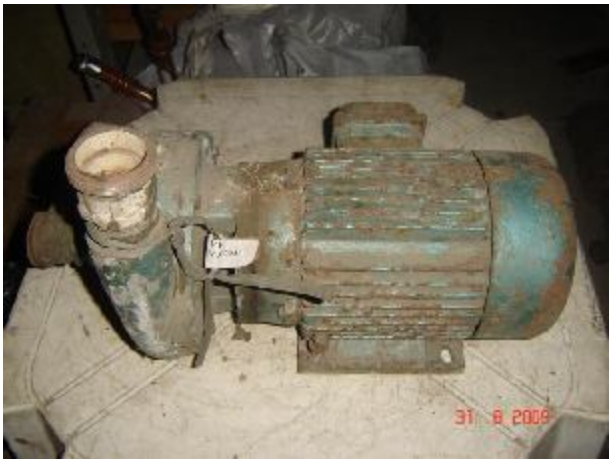
Lote 159 - MOTOR