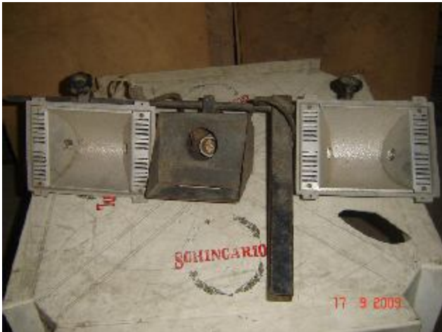
Lote 206 - REFLETORES