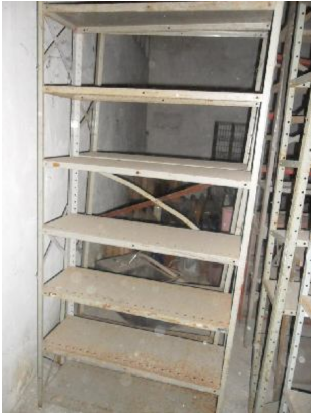
Lote 413 - SEM NÚMERO 213