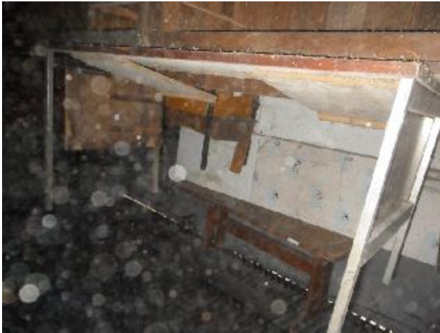
Lote 373 - SEM NÚMERO 172