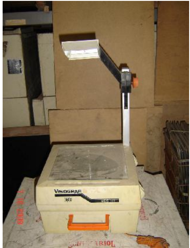
Lote 207 - RETROPROJETOR (VISOGRAF)