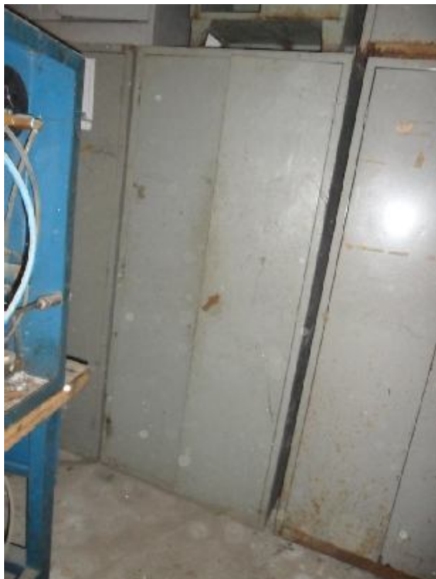
Lote 356 - SEM NÚMERO 155