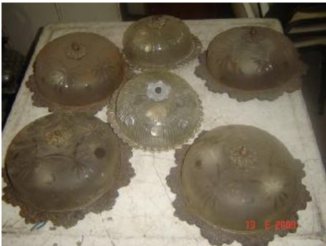
Lote 49 - 06 LUMINÁRIAS