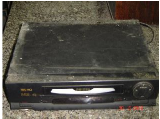
Lote 457 - VIDEO CASSETE (PHILIPS)