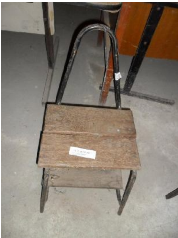
Lote 231 - SEM NÚMERO 029