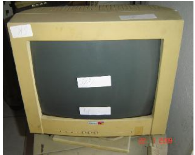
Lote 152 - MONITOR (KELIX)