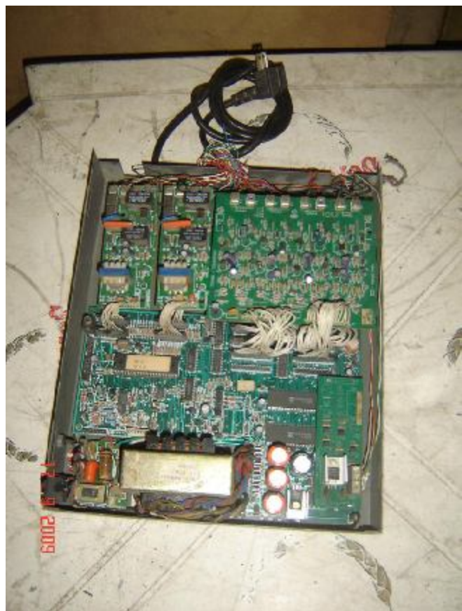
Lote 60 - APARELHO