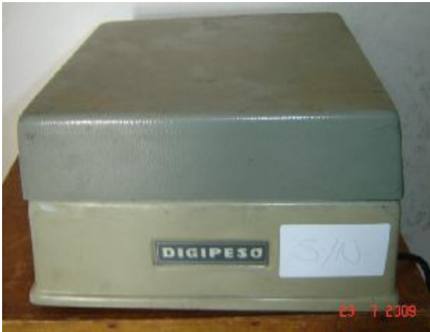
Lote 63 - APARELHO (DIGIPESO)