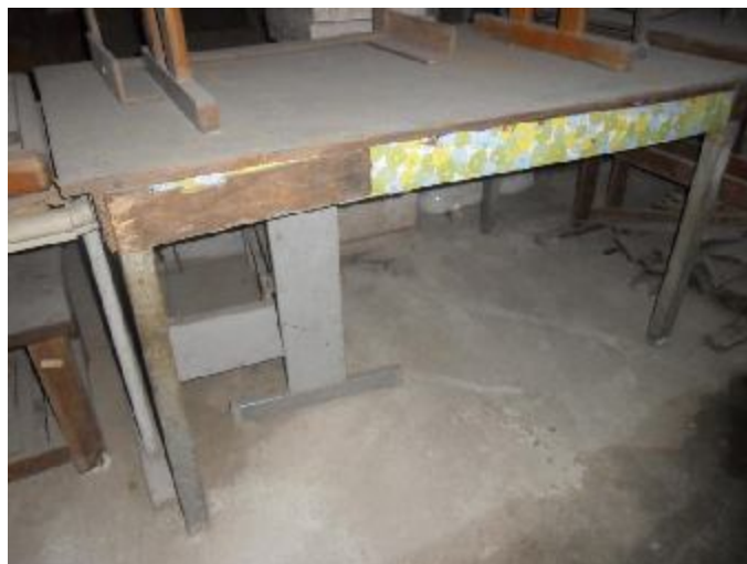
Lote 314 - SEM NÚMERO 112