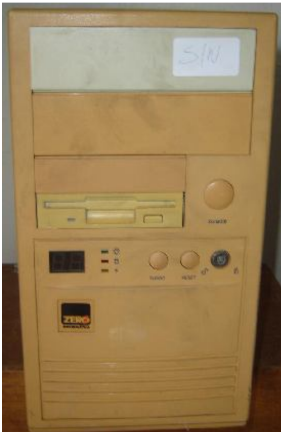
Lote 108 - CPU (ZERO INFORMÁTICA)