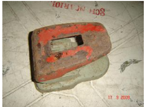
Lote 126 - FURADOR