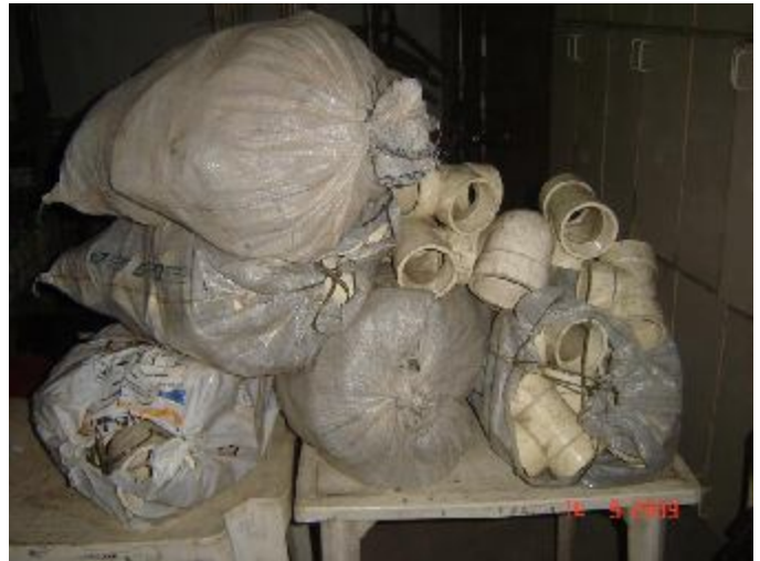
Lote 48 - 05 SACOS COM OBJETOS NATALINOS