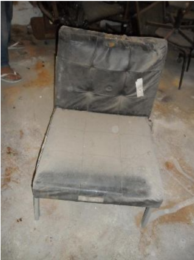
Lote 298 - SEM NÚMERO 96