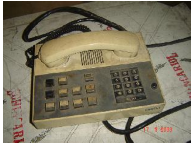
Lote 75 - APARELHO TELEFÔNICO - INTELBRAS