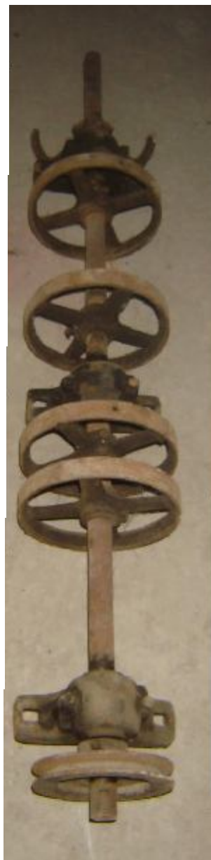
Lote 11 - Eixo de porta de Correr