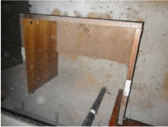
Lote 403 - SEM NÚMERO 203