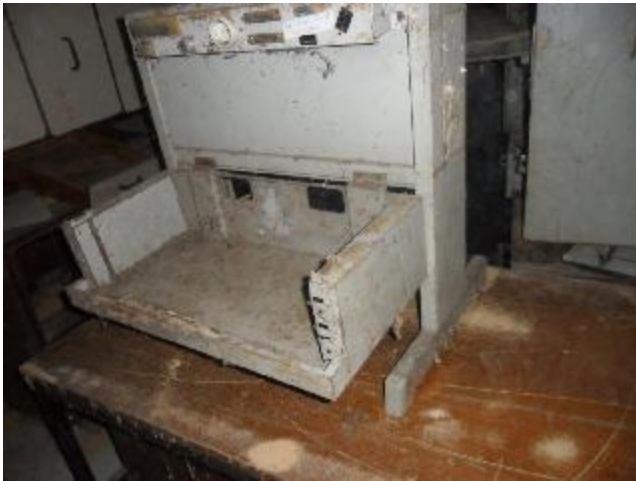
Lote 405 - SEM NÚMERO 205