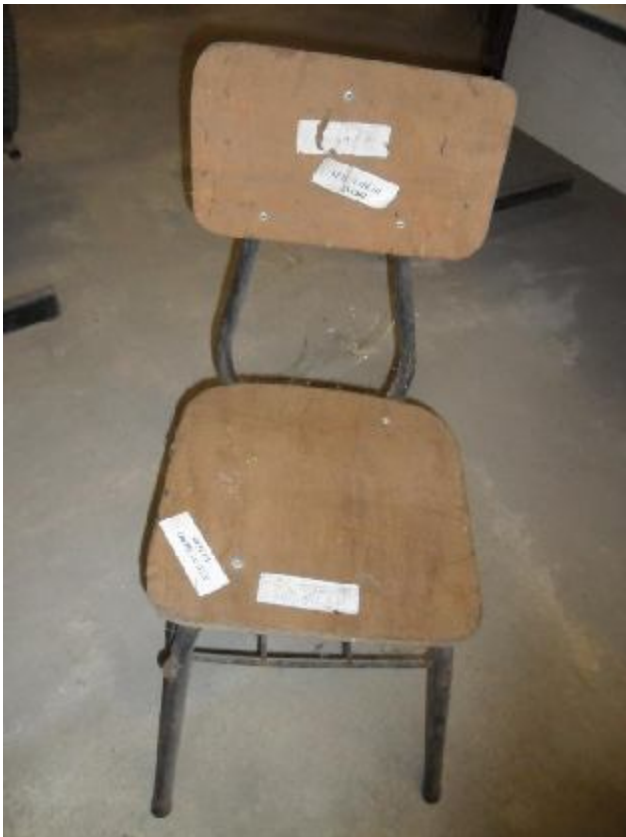
Lote 233 - SEM NÚMERO 021