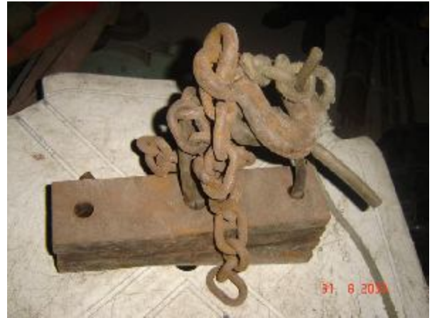
Lote 116 - FERRO TIPO REBOQUE, COM CORRENTE