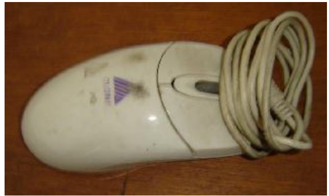
Lote 164 - MOUSE (FIVE STAR)