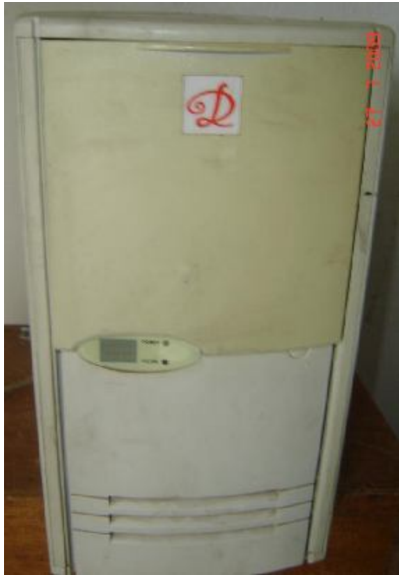
Lote 110 - CPU vertical - D