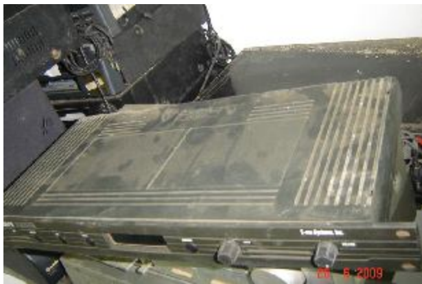
Lote 112 - DECK (PROTEUS)