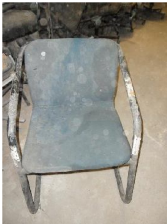
Lote 261 - SEM NÚMERO 059