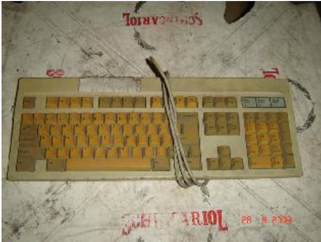
Lote 417 - TECLADO