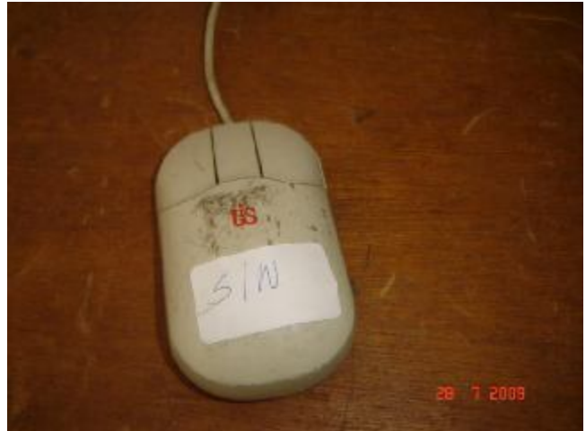
Lote 182 - MOUSE, (UIS)