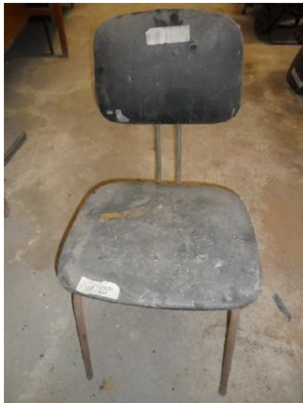
Lote 234 - SEM NÚMERO 031