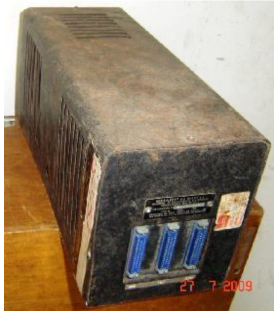
Lote 64 - APARELHO (SHARP)