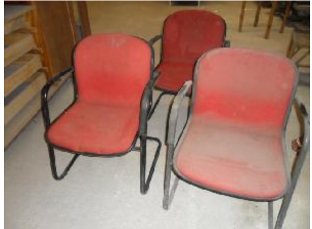
Lote 216 - SEM NÚMERO 004