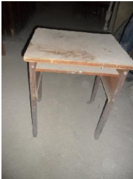
Lote 321 - SEM NÚMERO 120