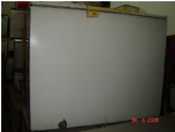
Lote 125 - FREEZER (PROSDÓCIMO)