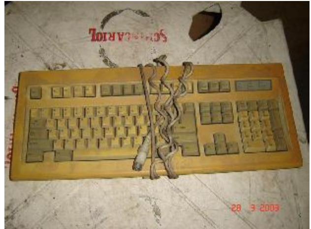
Lote 418 - TECLADO