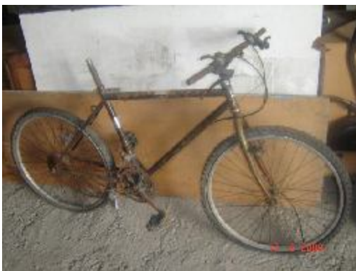
Lote 04 - Bicicleta enferrujada (1)