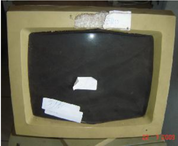
Lote 151 - MONITOR (ADD)