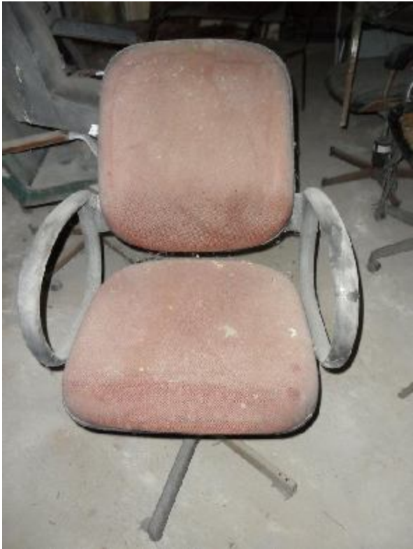
Lote 330 - SEM NÚMERO 129