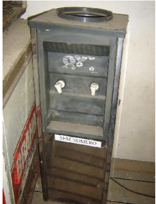
Lote 79 - BEBEDOURO AZUL INOX