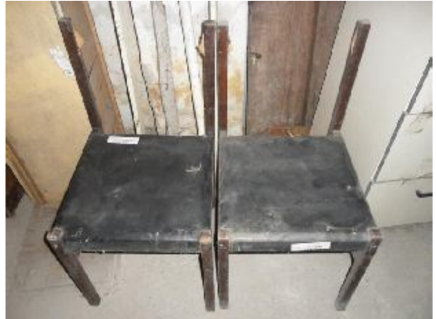
Lote 242 - SEM NÚMERO 040