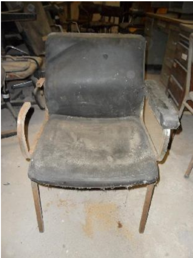
Lote 274 - SEM NÚMERO 72