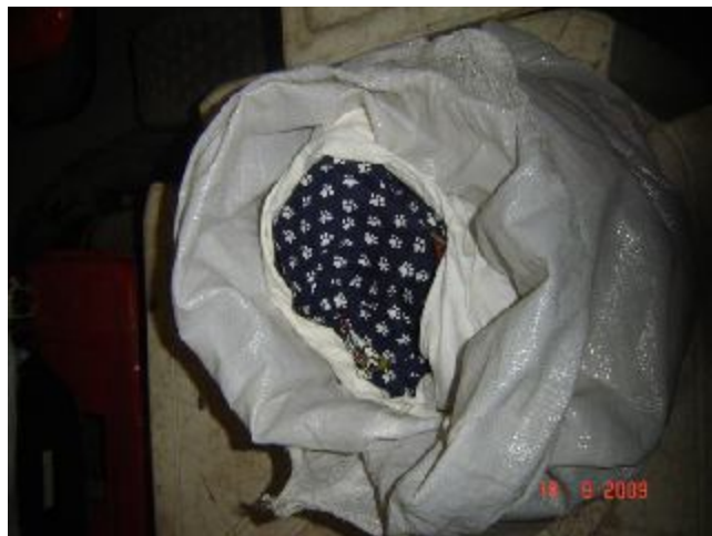
Lote 43 - 04 CAMISAS