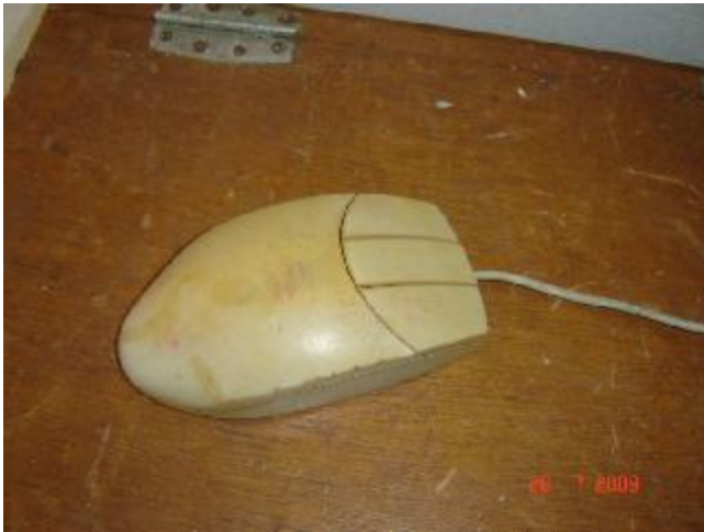
Lote 179 - MOUSE, (S. MARCA)