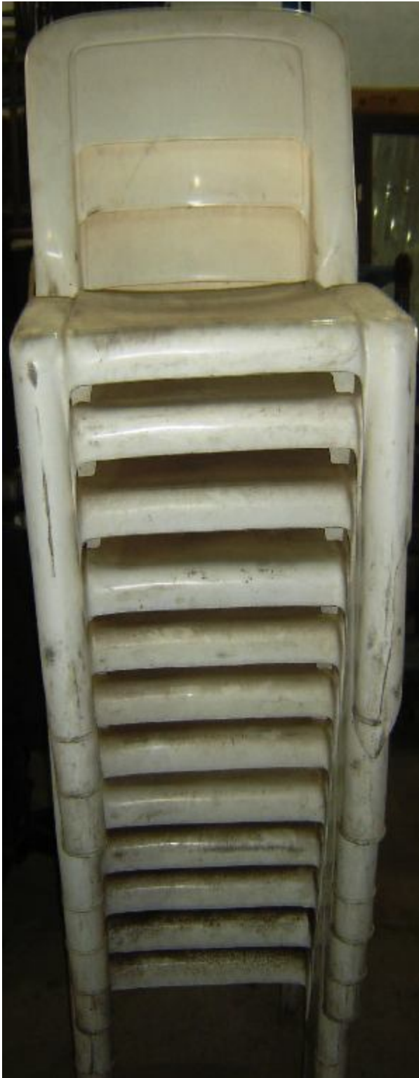
Lote 55 - 12 CADEIRAS PLASTC. BRANCAS