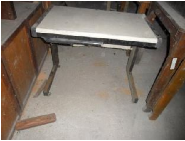
Lote 379 - SEM NÚMERO 178