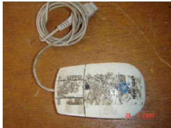
Lote 164 - MOUSE (FIVE STAR)