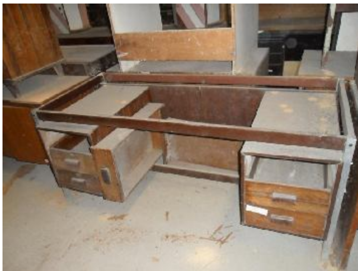
Lote 251 - SEM NÚMERO 049