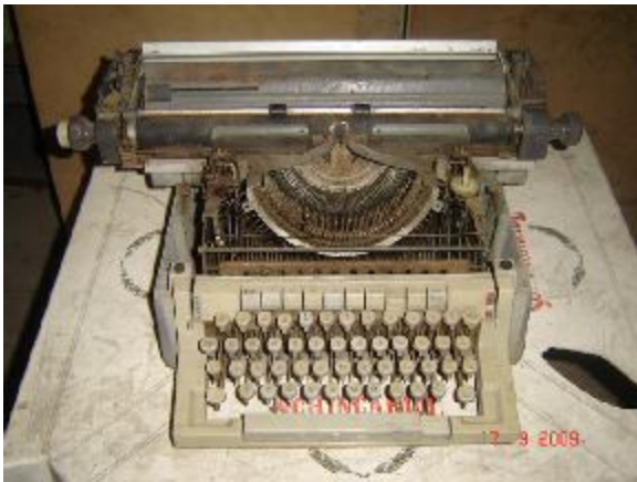
Lote 141 - MAQUINA DE ESCREVER OLIVETTI