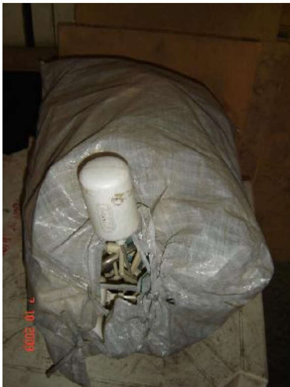
Lote 80 - BÓIAS (AKROS)