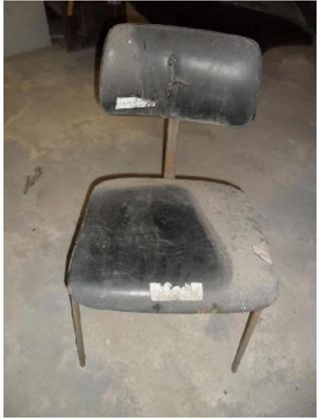
Lote 297 - SEM NÚMERO 95