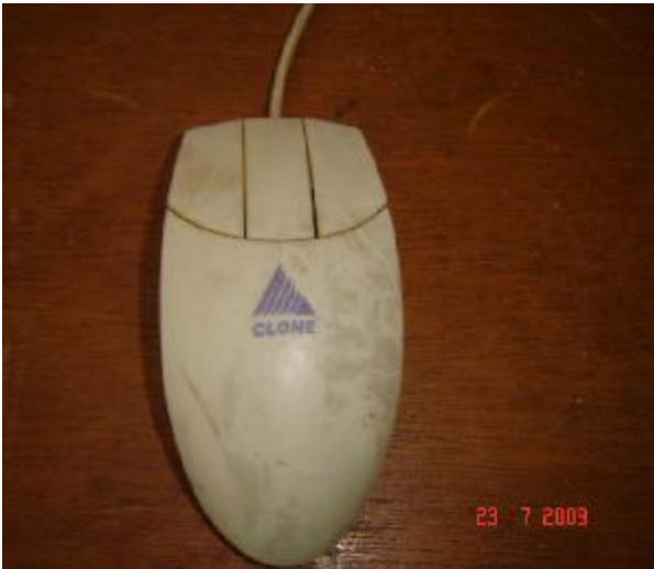
Lote 161 - MOUSE (CLONE)