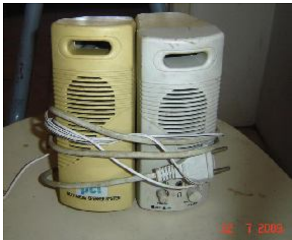
Lote 88 - CAIXINHAS DE SOM PARA PC (AUDITEK)