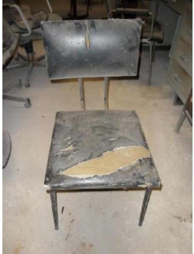
Lote 281 - SEM NÚMERO 79