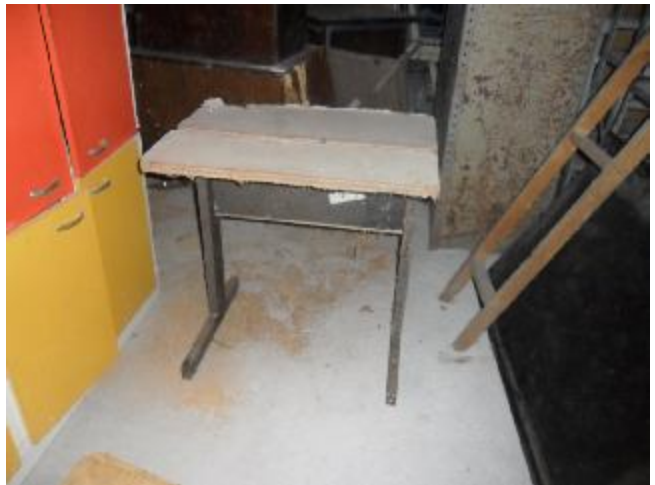
Lote 406 - SEM NÚMERO 206