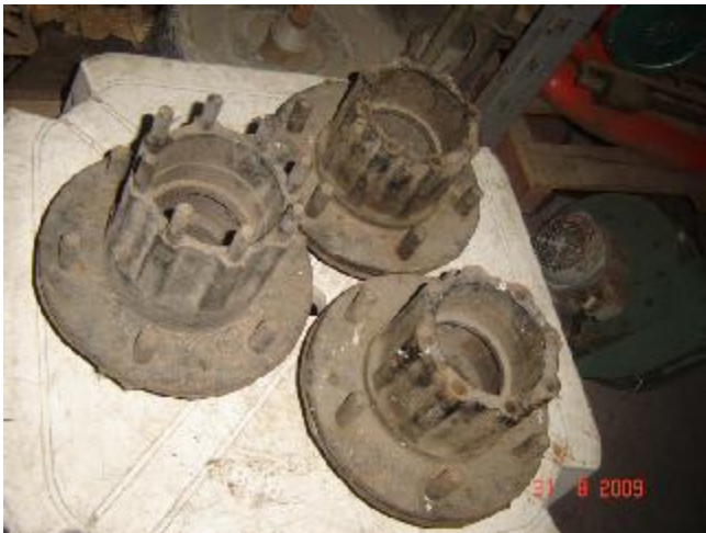
Lote 200 - PEÇAS (FERRO)