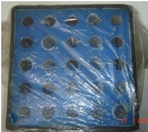
Lote 191 - OBJETO N DENTIFICADO - S.MARCA