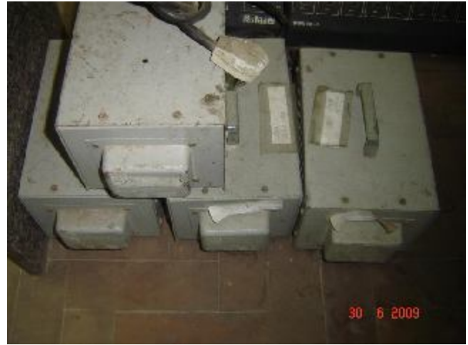
Lote 199 - PEÇAS (04) N-IDENTIFICADOS