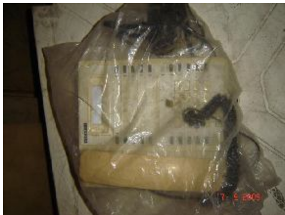
Lote 69 - APARELHO TELEFÔNICO - ALCATEL