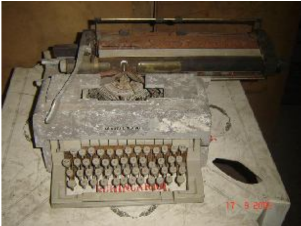
Lote 139 - MAQUINA DE ESCREVER