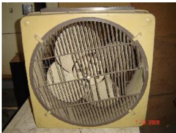
Lote 90 - CIRCULADOR (ARNO)