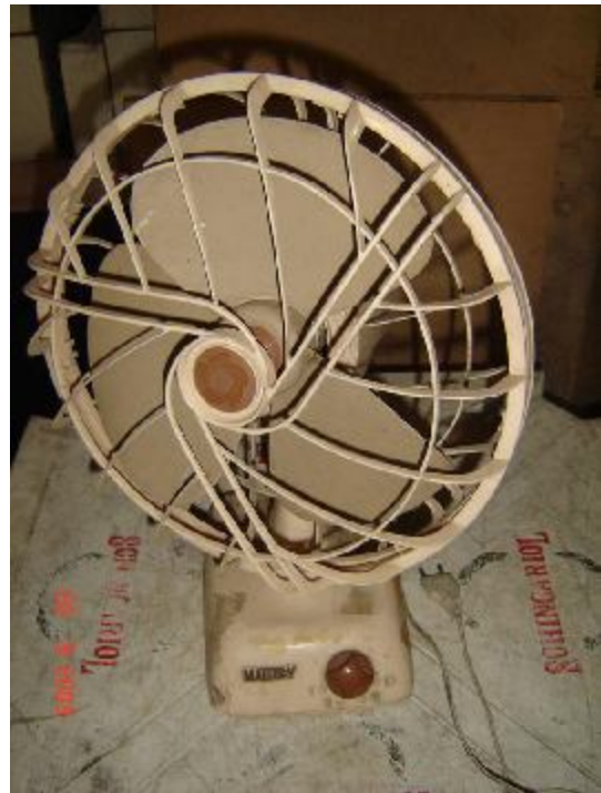
Lote 455 - VENTILADOR (MALLORY)