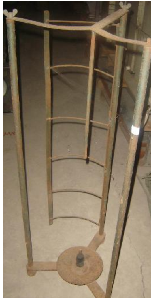
Lote 23 - Peça de ferro