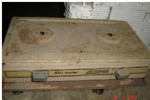
Lote 121 - FOGÃO (CONTINENTAL - JOLI MASTER)