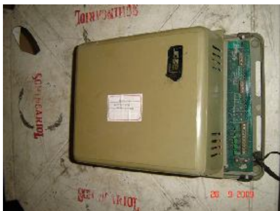
Lote 70 - APARELHO FASOR