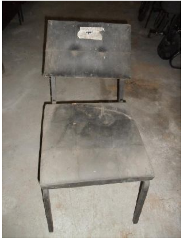
Lote 230 - SEM NÚMERO 028