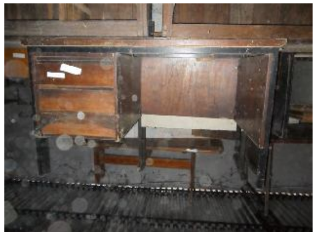
Lote 372 - SEM NÚMERO 171