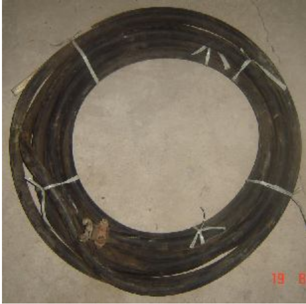
Lote 14 -Mangueira de Força