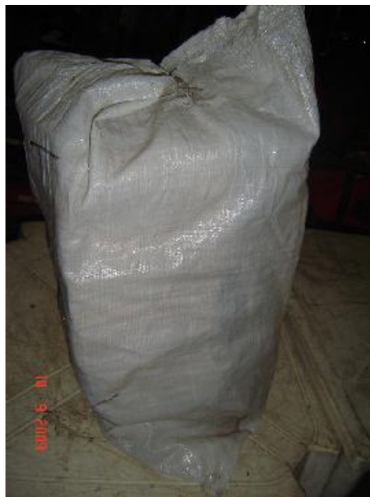
Lote 194 - OBJETOS NATALINOS