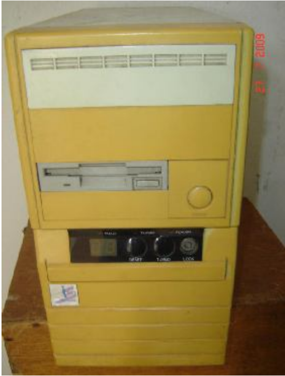
Lote 99 - CPU (IS)