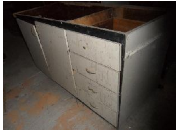
Lote 370 - SEM NÚMERO 168