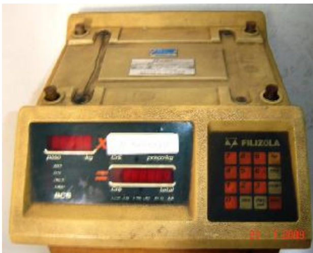
Lote 76 - BALANÇA (FILIZOLA)