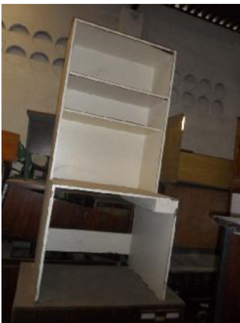
Lote 288 - SEM NÚMERO 86