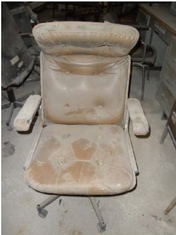
Lote 286 - SEM NÚMERO 84