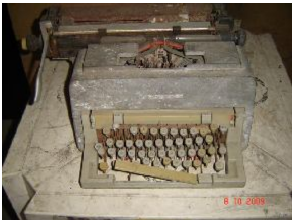
Lote 143 - MAQUINA DE ESCREVER