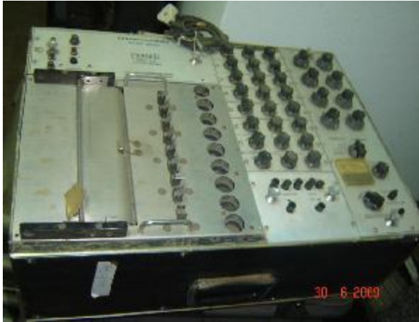
Lote 115 - ELETROCEFALOGRAFO