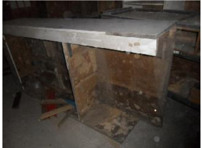
Lote 374 - SEM NÚMERO 173