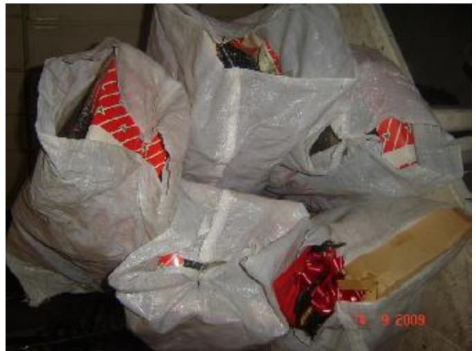
Lote 48 - 05 SACOS COM OBJETOS NATALINOS