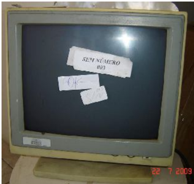
Lote 153 - MONITOR (DATAS)