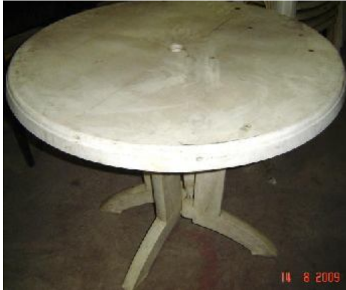
Lote 18 - Mesa Redonda