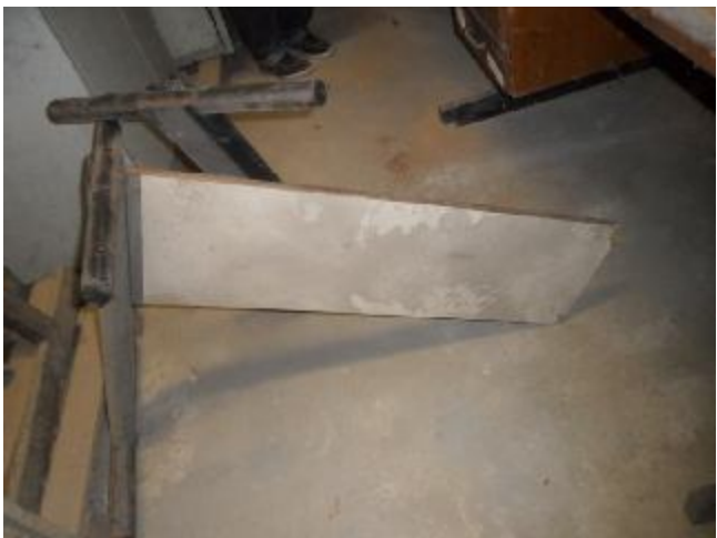
Lote 338 - SEM NÚMERO 137