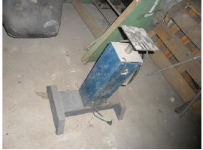
Lote 363 - SEM NÚMERO 162