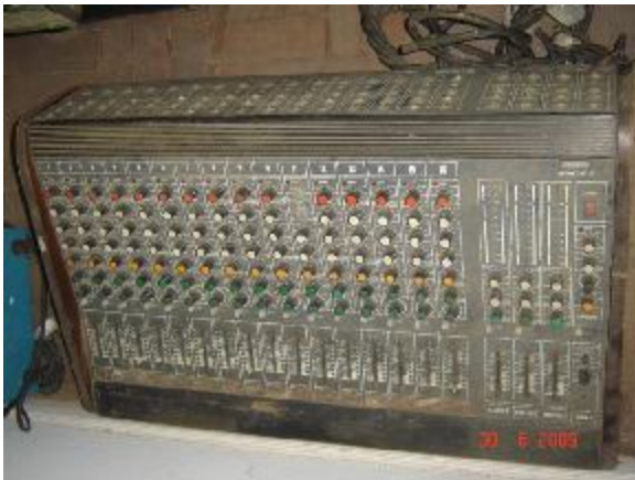
Lote 147 - MESA DE SOM (STANER)