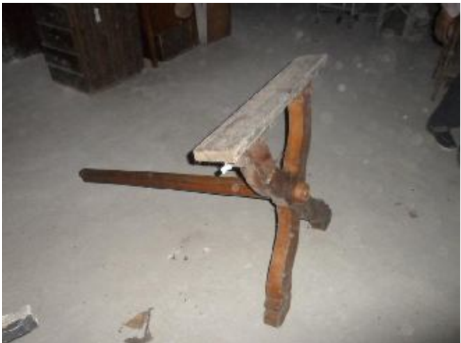
Lote 364 - SEM NÚMERO 163