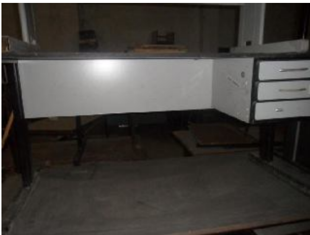
Lote 304 - SEM NÚMERO 102