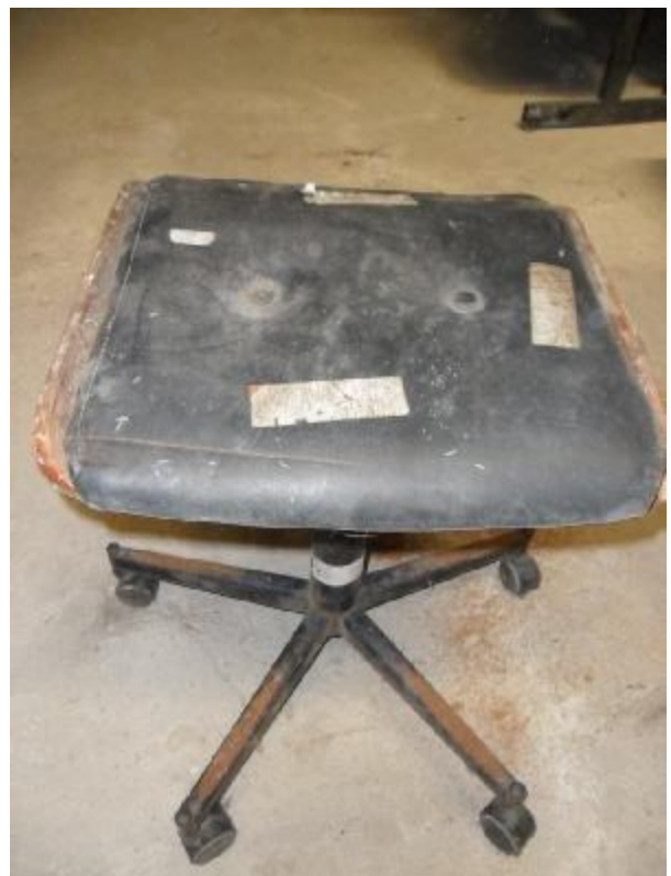
Lote 226 - SEM NÚMERO 014