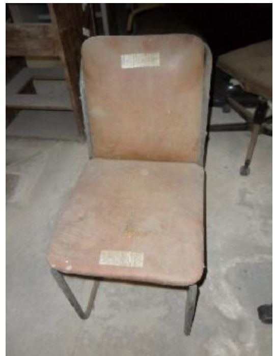
Lote 255 - SEM NÚMERO 053