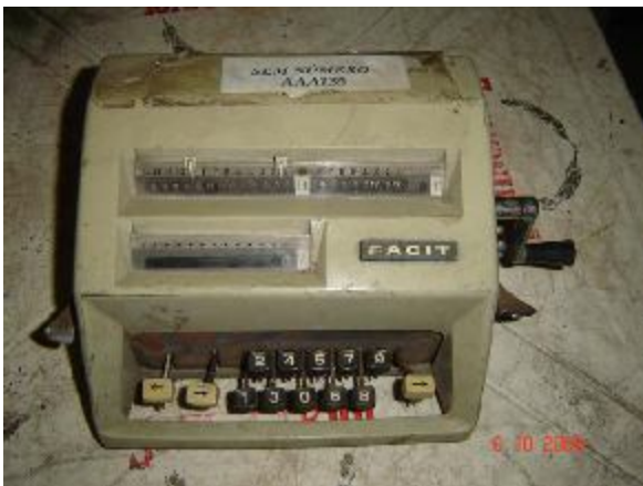
Lote 135 - MAQUINA (FACIT)