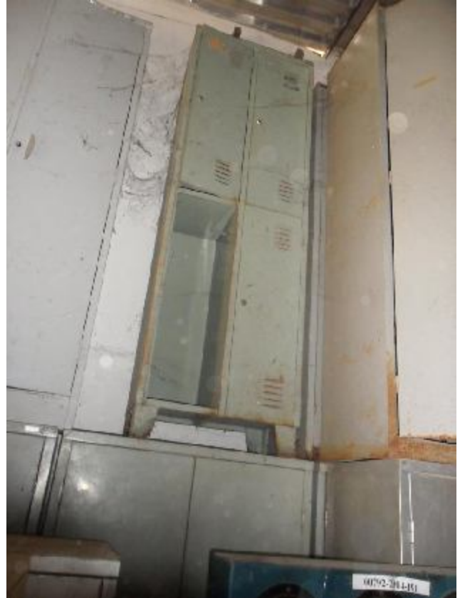
Lote 353 - SEM NÚMERO 152