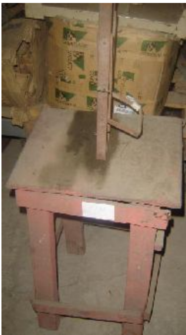
Lote 02 - Banco com um garfo de bicicleta