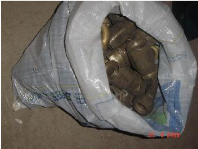
Lote 198 - PEÇA TIPO CANO DE FERRO PARA TORNEIRA