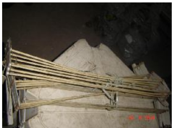
Lote 120 - FERROS