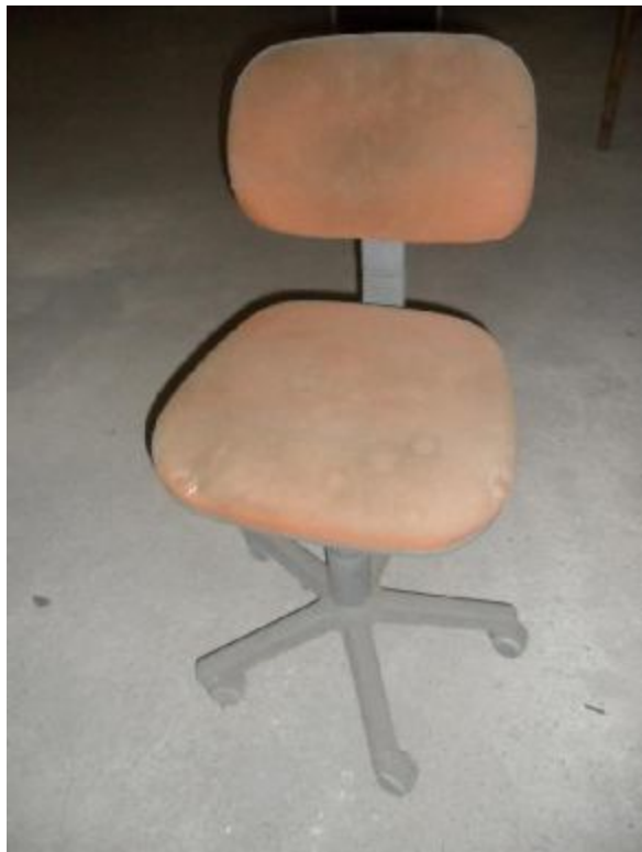
Lote 82 - CADEIRA COM RODINHAS VERMELHA