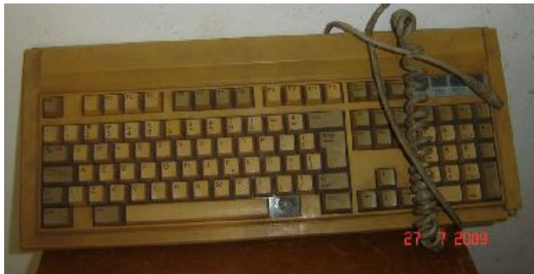
Lote 435 - TECLADO (SND)