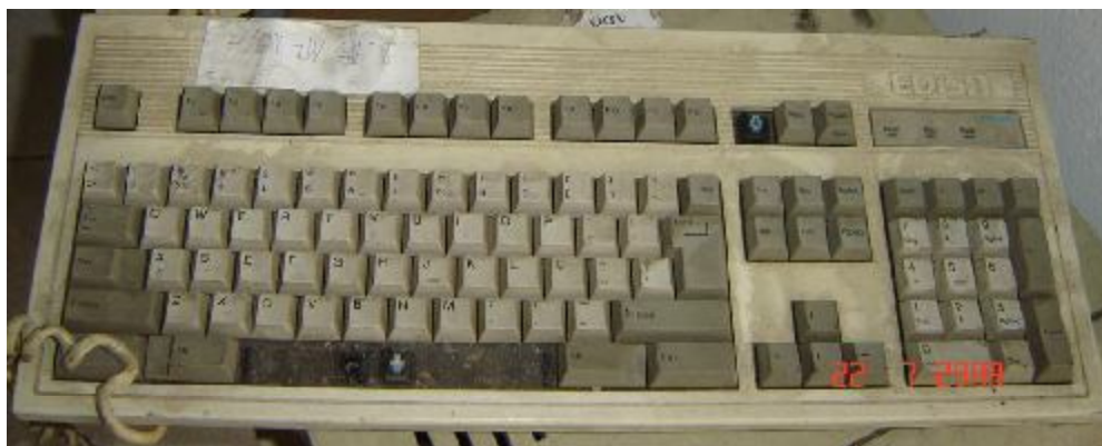
Lote 426 - TECLADO (ITAUTEC)