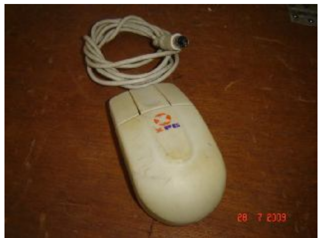
Lote 172 - MOUSE, (XPC)