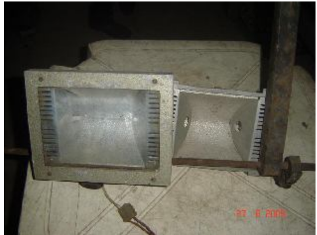
Lote 205 - REFLETORES