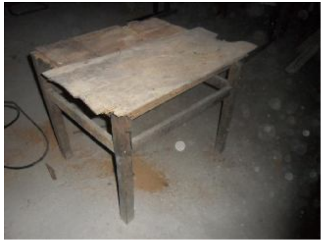
Lote 388 - SEM NÚMERO 188