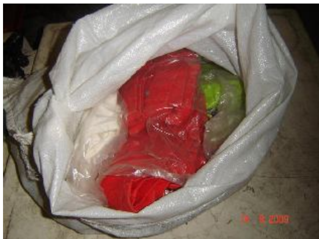
Lote 209 - ROUPAS VARIADAS