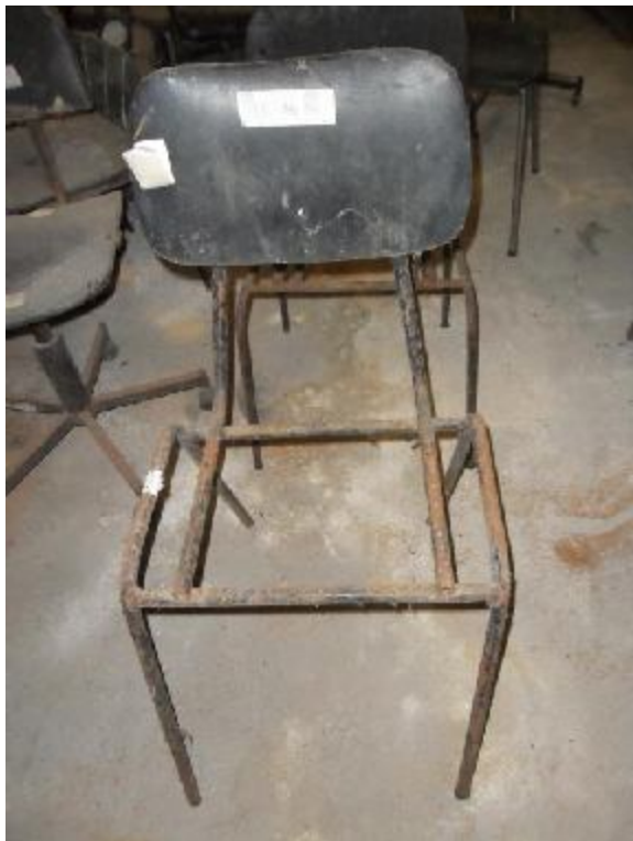
Lote 244 - SEM NÚMERO 042