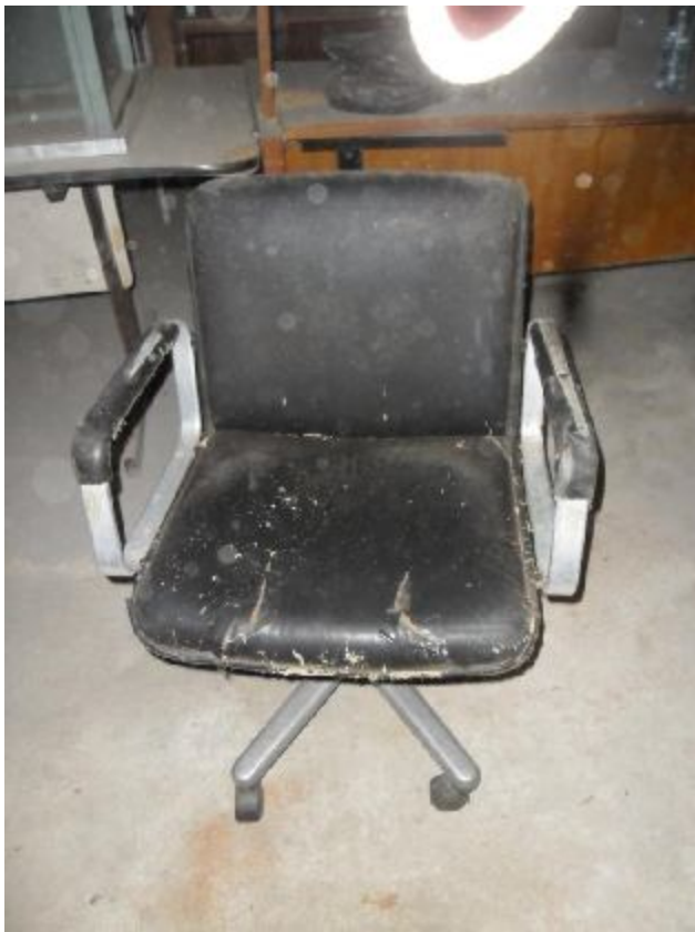
Lote 235 - SEM NÚMERO 023