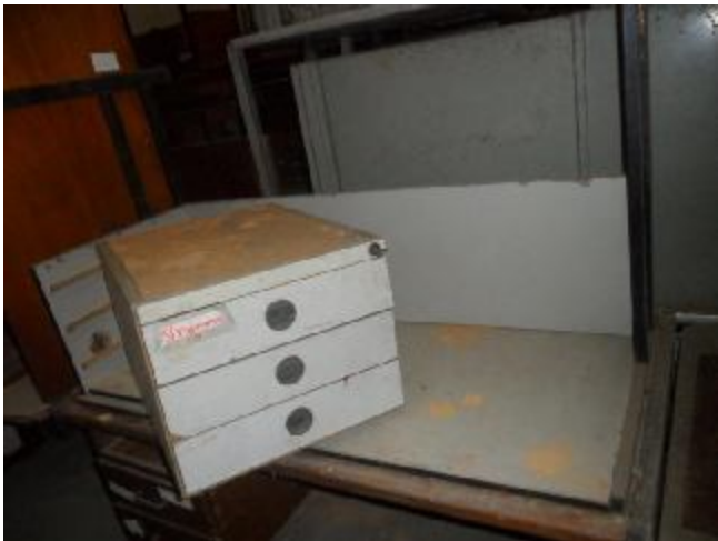
Lote 336 - SEM NÚMERO 135