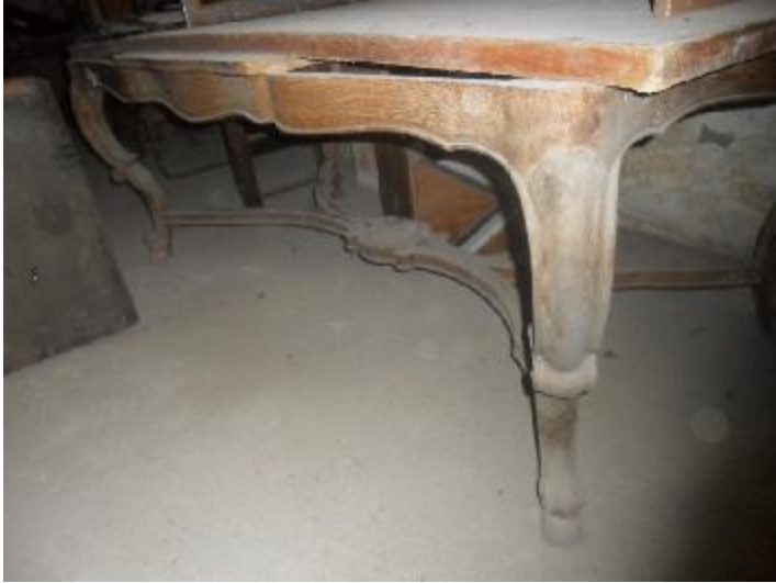
Lote 306 - SEM NÚMERO 104