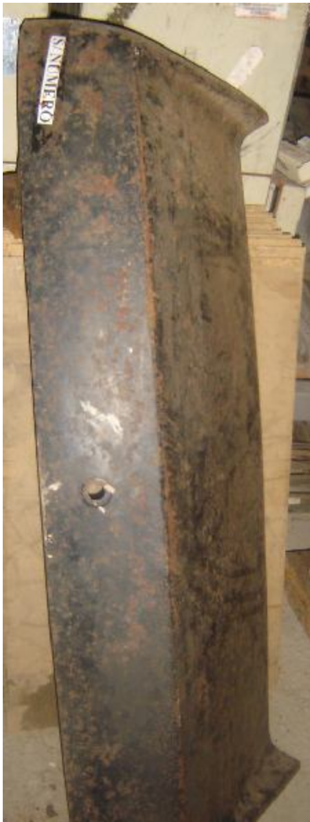
Lote 22 - Peça de chaparia de automóvel