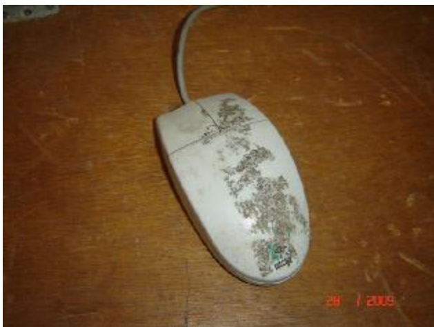
Lote 177 - MOUSE, (LOGITECH)