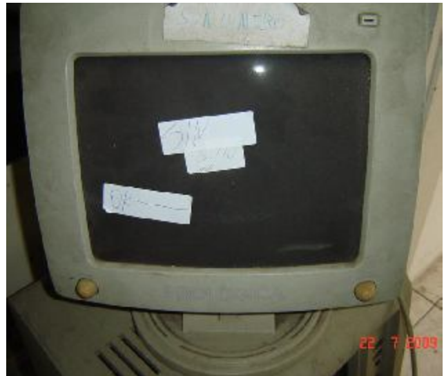
Lote 148 - MONITOR - PROLOGICA