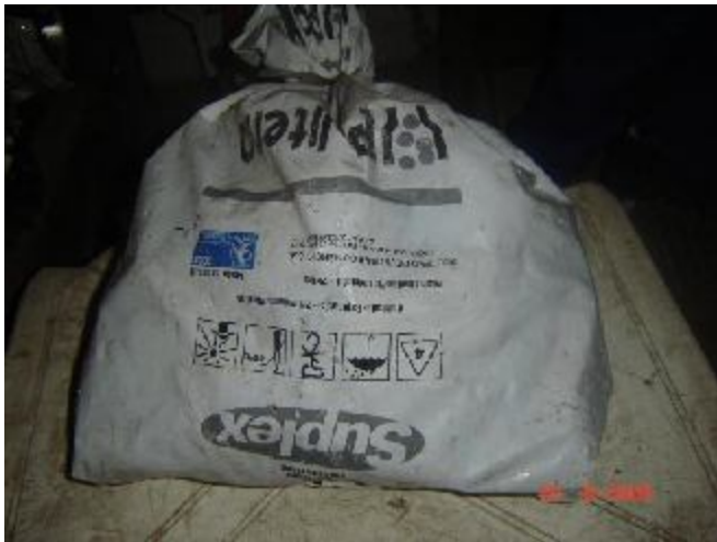
Lote 26 - 01 SACO COM CANOS EM FORMA DE 'T'