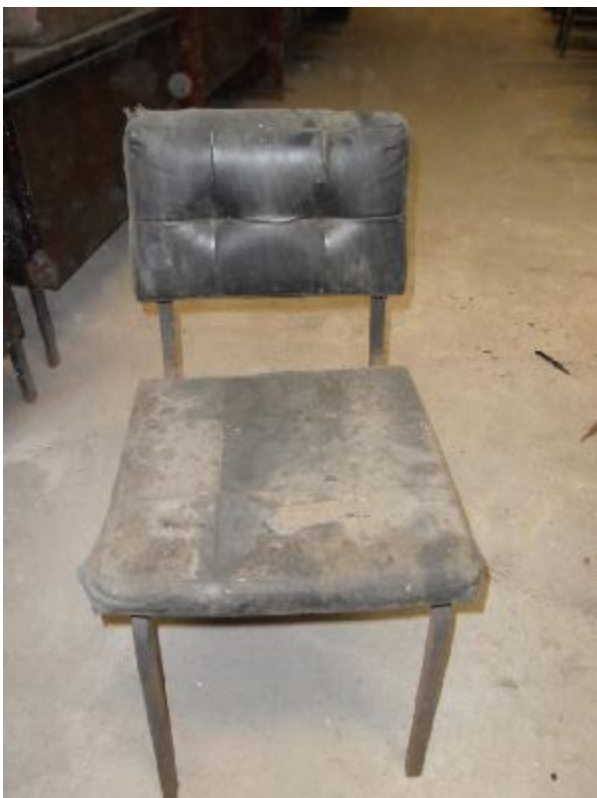
Lote 229 - SEM NÚMERO 017