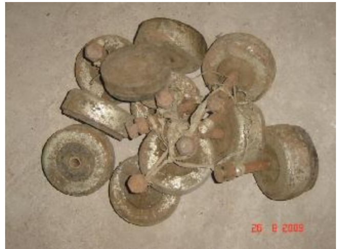
Lote 201 - PEÇAS DE FERRO