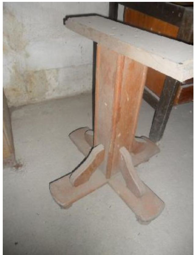
Lote 319 - SEM NÚMERO 119