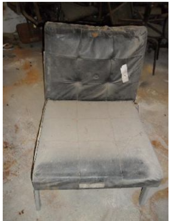
Lote 309 - SEM NÚMERO 107