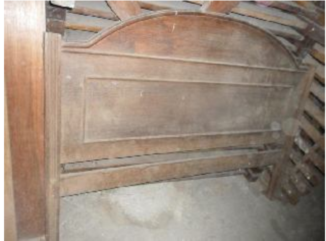
Lote 380 - SEM NÚMERO 179