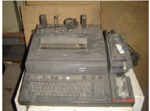
Lote 142 - MAQUINA DE ESCREVER OL- IVETTI TE 520