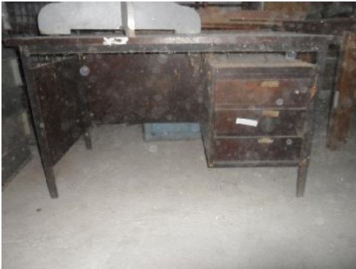
Lote 362 - SEM NÚMERO 161