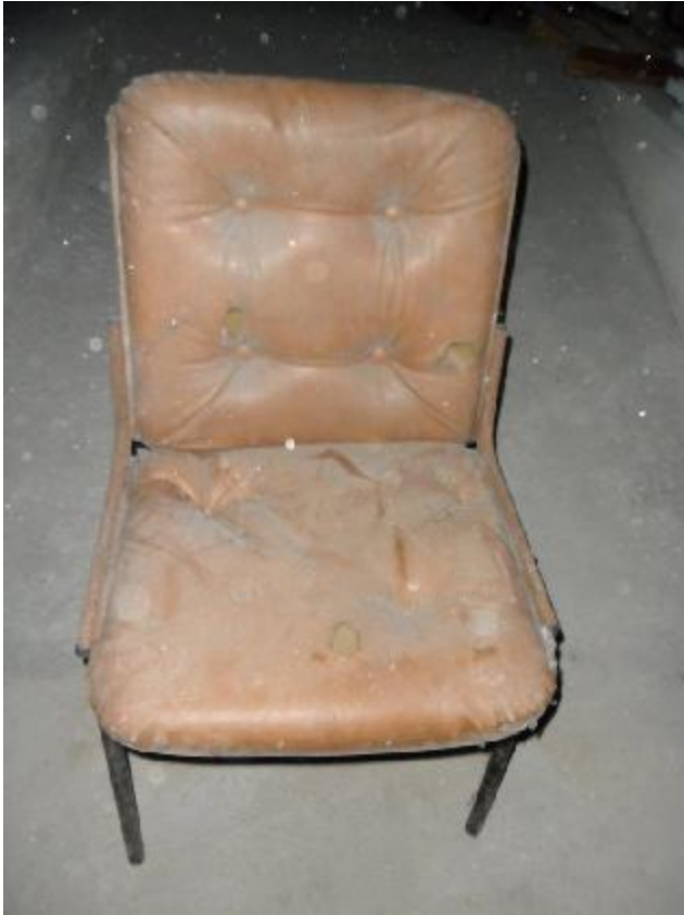
Lote 268 - SEM NÚMERO 66