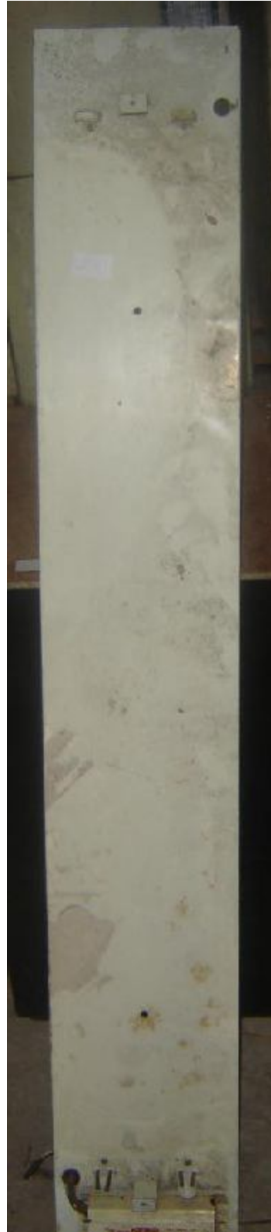
Lote 07 - Calha para lâmpada Florescente