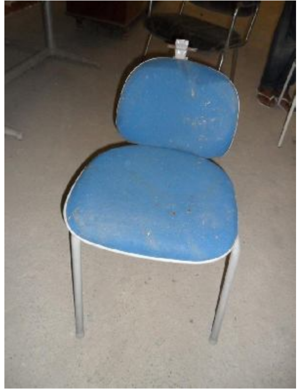
Lote 224 - SEM NÚMERO 011