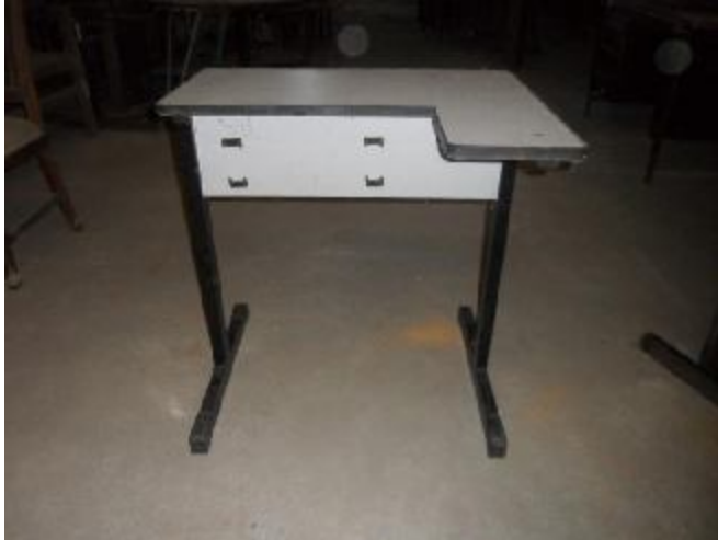
Lote 284 - SEM NÚMERO 82