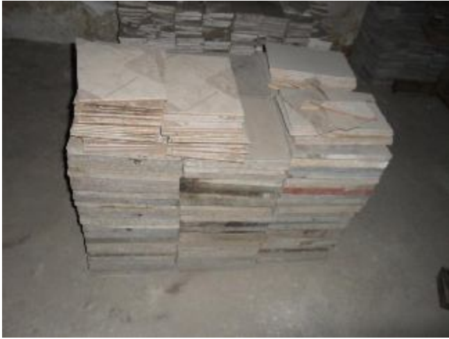
Lote 360 - SEM NÚMERO 159