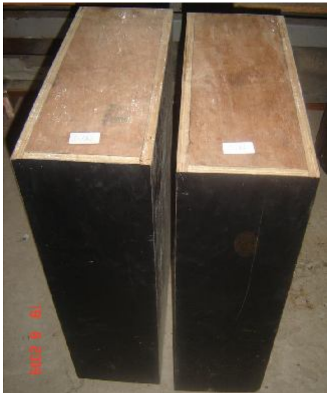
Lote 34 - DUAS PERNAS DE MESA