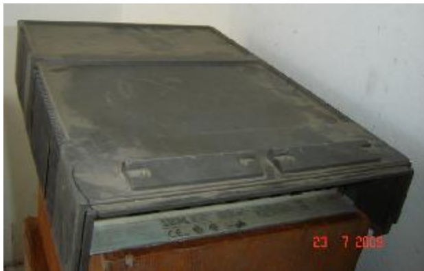
Lote 65 - APARELHO (IBM)