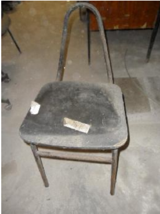
Lote 252 - SEM NÚMERO 050