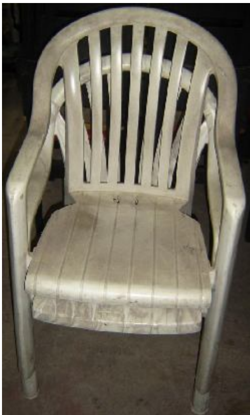
Lote 32 - 02 CADEIRAS PLASTIC. (GROFILEX)