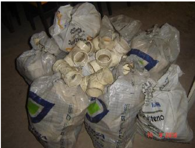
Lote 53 - 09 SACOS DE CANOS - BRANCOS