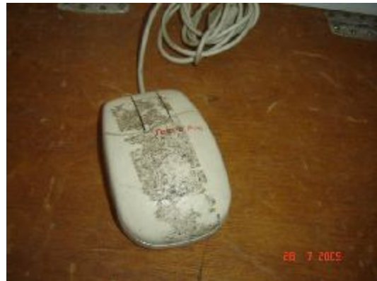
Lote 170 - MOUSE SEM MARCA