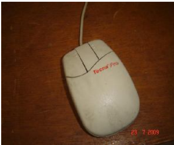
Lote 169 - MOUSE (TECNA PRO)