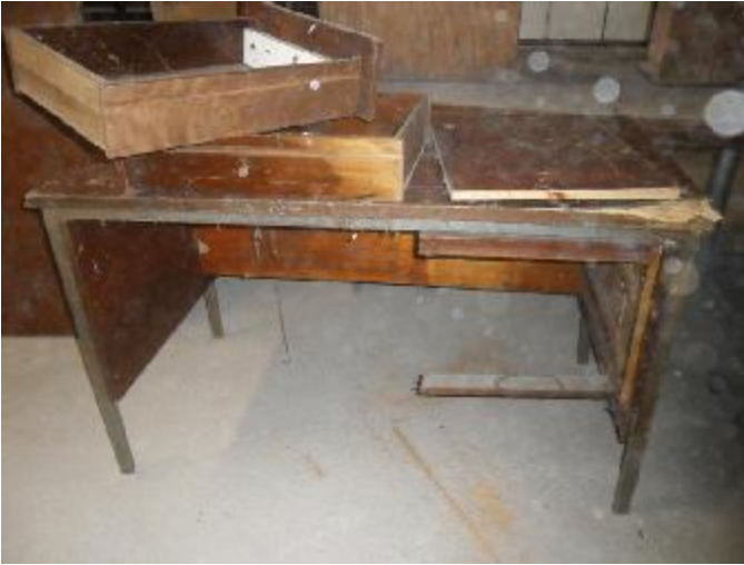
Lote 316 - SEM NÚMERO 114