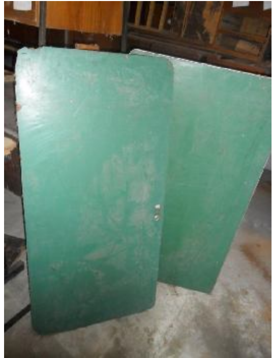
Lote 317- SEM NÚMERO 115