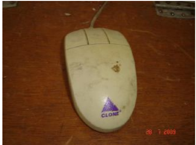
Lote 180 - MOUSE, (CLONE)