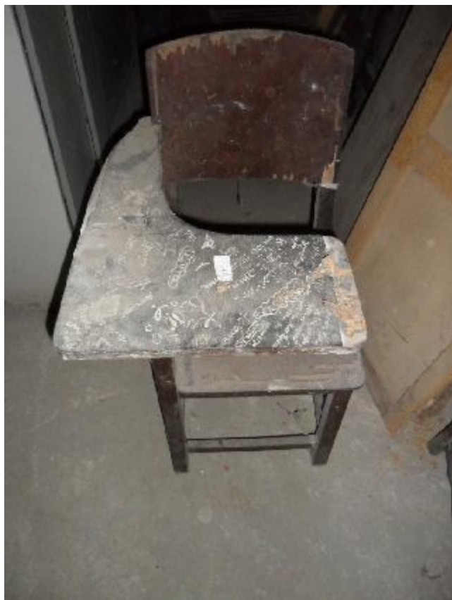
Lote 350 - SEM NÚMERO 149