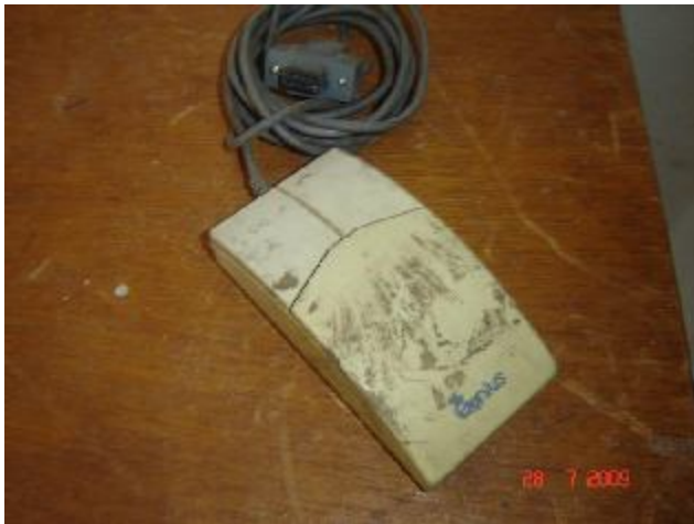
Lote 175 - MOUSE, (GENIUS)