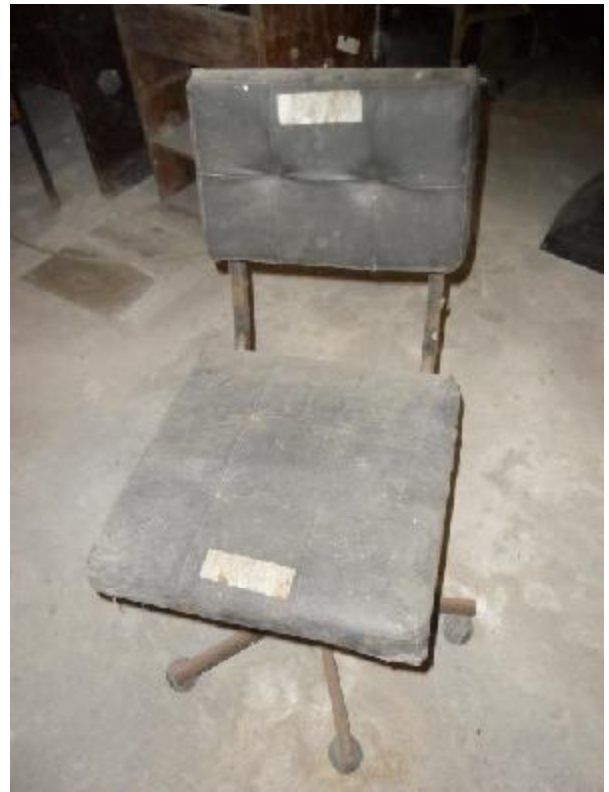
Lote 253 - SEM NÚMERO 051