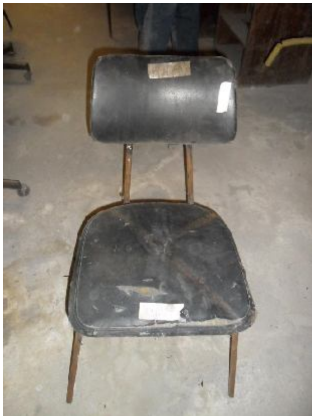
Lote 238 - SEM NÚMERO 036