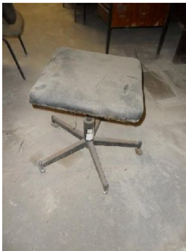
Lote 257 - SEM NÚMERO 055