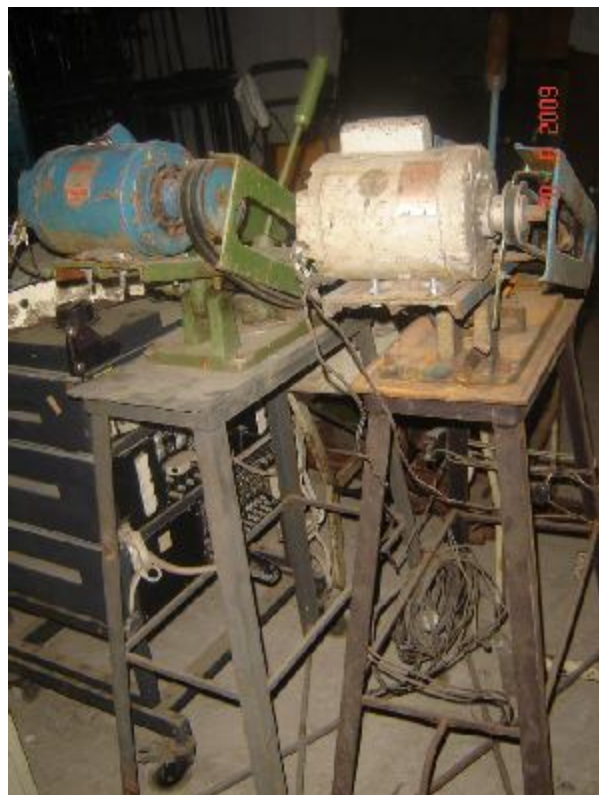
Lote 35 - 02 MÁQUINAS DE SERRAR