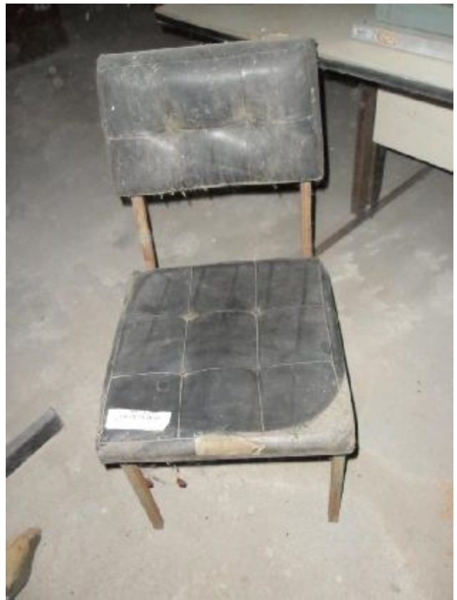
Lote 236 - SEM NÚMERO 024