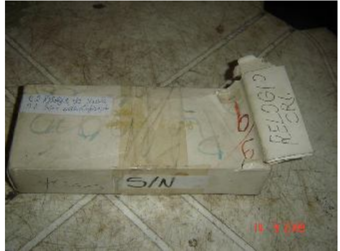
Lote 52 - 09 RELÓGIOS