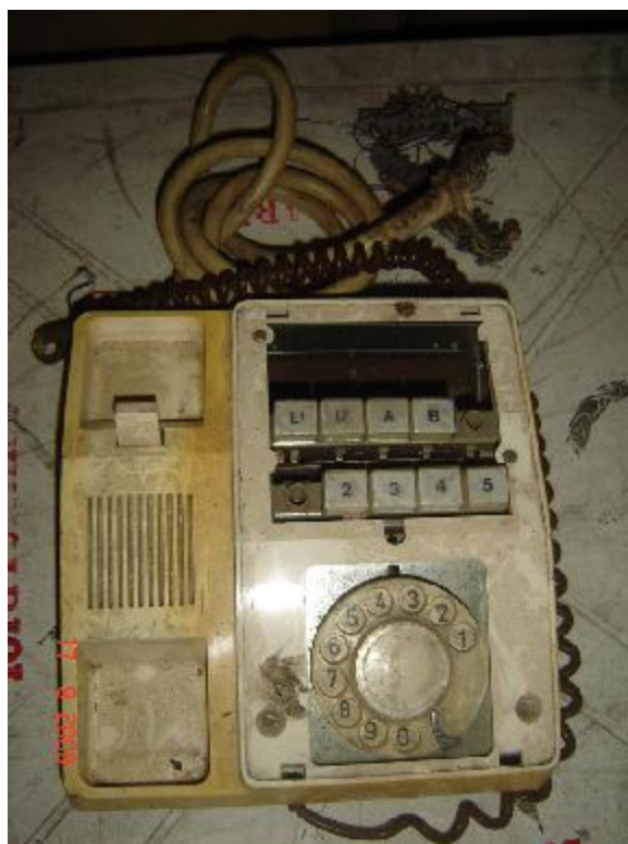
Lote 71 - APARELHO TELEFÔNICO