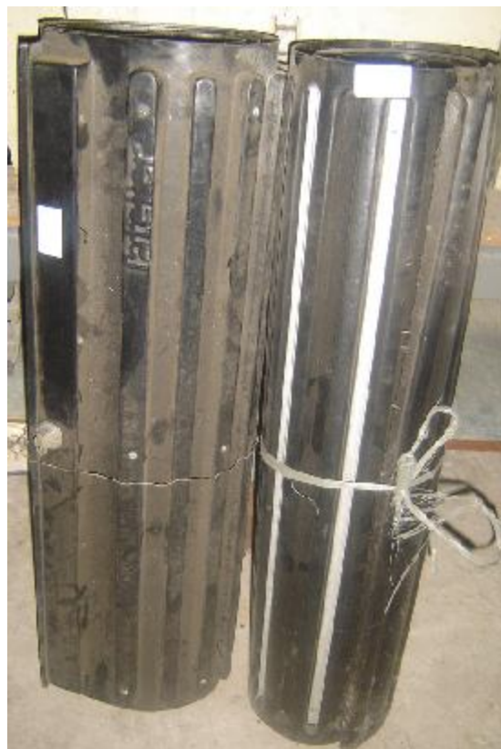
Lote 38 - 02 PORTAS DE CORRER