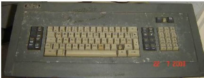
Lote 434 - TECLADO (SEM MARCA)