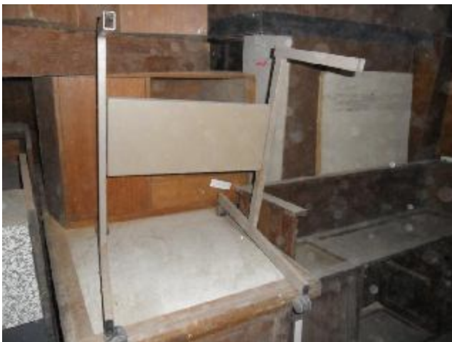
Lote 377 - SEM NÚMERO 176