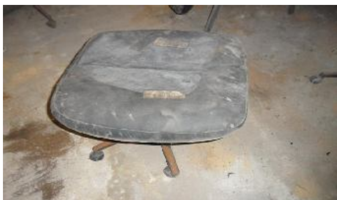
Lote 250 - SEM NÚMERO 048