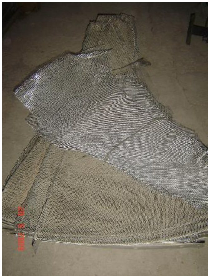
Lote 58 - 15 TELAS GRADEADAS DE ANTENA PARABÓLICA