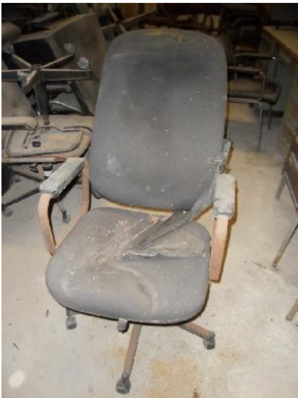
Lote 328 - SEM NÚMERO 127