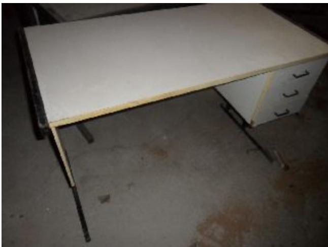
Lote 389 - SEM NÚMERO 189