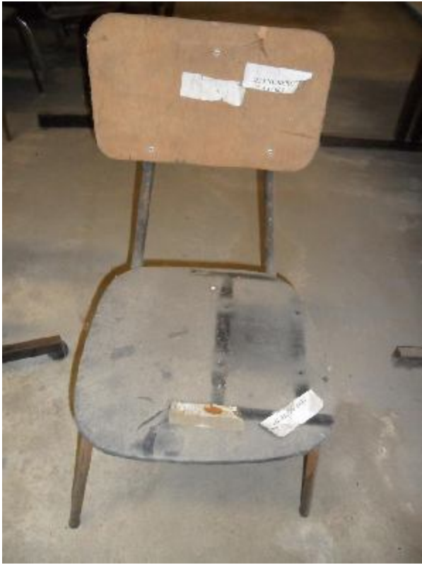
Lote 227 - SEM NÚMERO 015