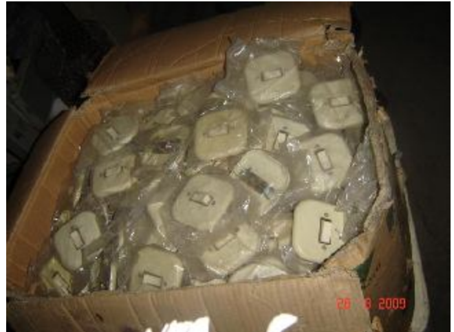
Lote 131 - INTERRUPTORES