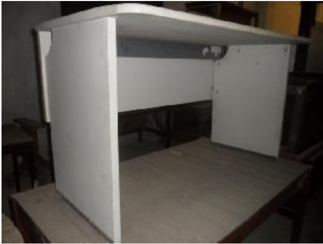
Lote 300 - SEM NÚMERO 98