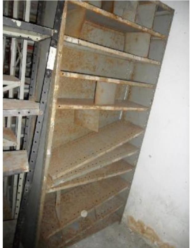
Lote 414 - SEM NÚMERO 214