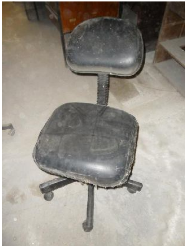
Lote 256 - SEM NÚMERO 054