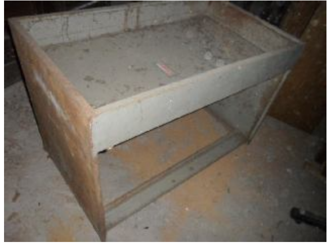
Lote 404 - SEM NÚMERO 204