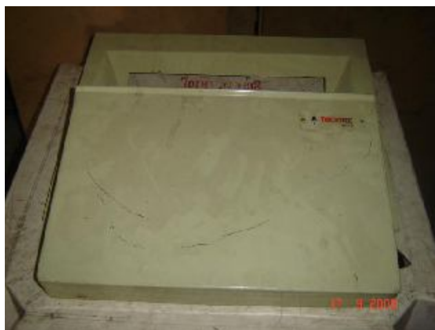
Lote 186 - OBJETO - MACROTEC