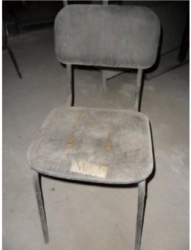
Lote 269 - SEM NÚMERO 67