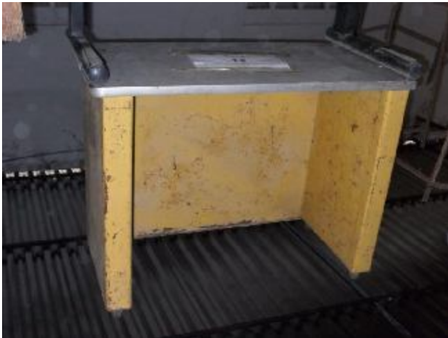
Lote 375 - SEM NÚMERO 174