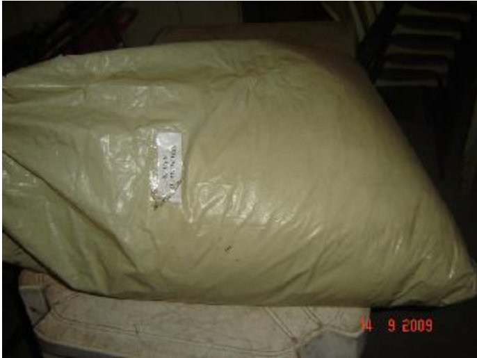
Lote 91 - CORTINAS