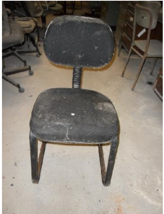
Lote 273 - SEM NÚMERO 71