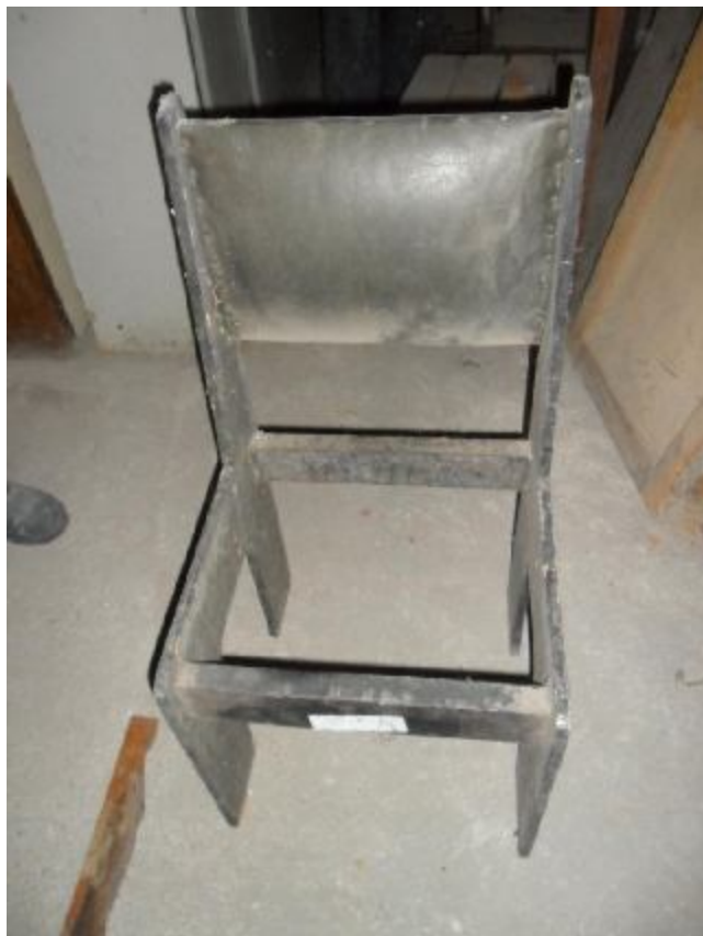
Lote 348 - SEM NÚMERO 147