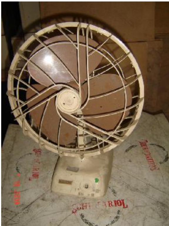
Lote 456 - VENTILADOR (MALLORY)