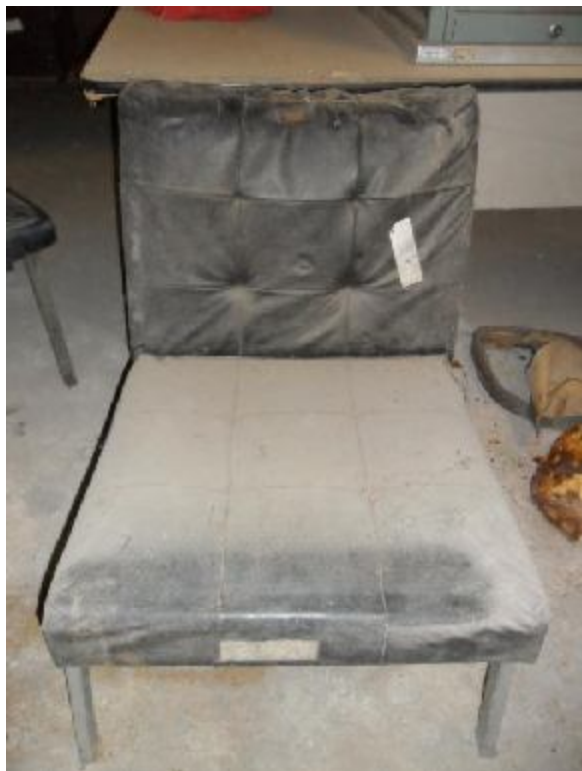
Lote 246 - SEM NÚMERO 044