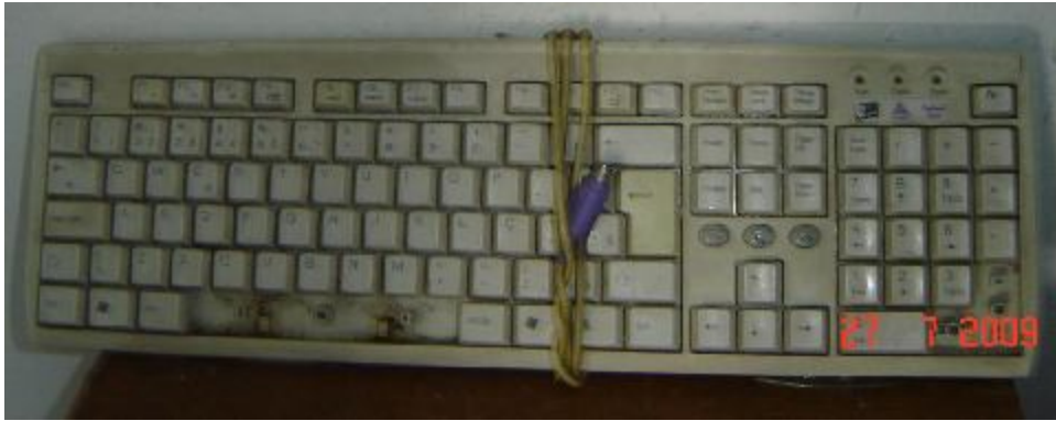
Lote 422 - TECLADO ( SEM MARCA)