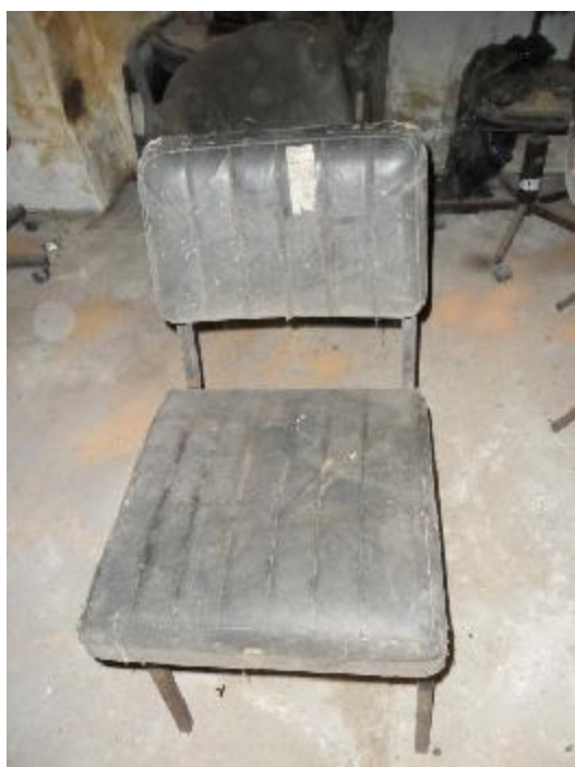
Lote 262 - SEM NÚMERO 060