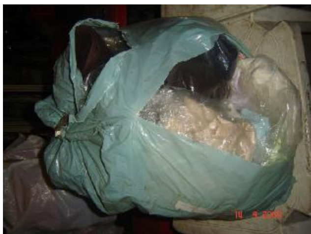
Lote 211 - ROUPAS VARIADAS