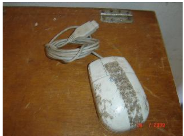
Lote 176 - MOUSE, (GENIUS)