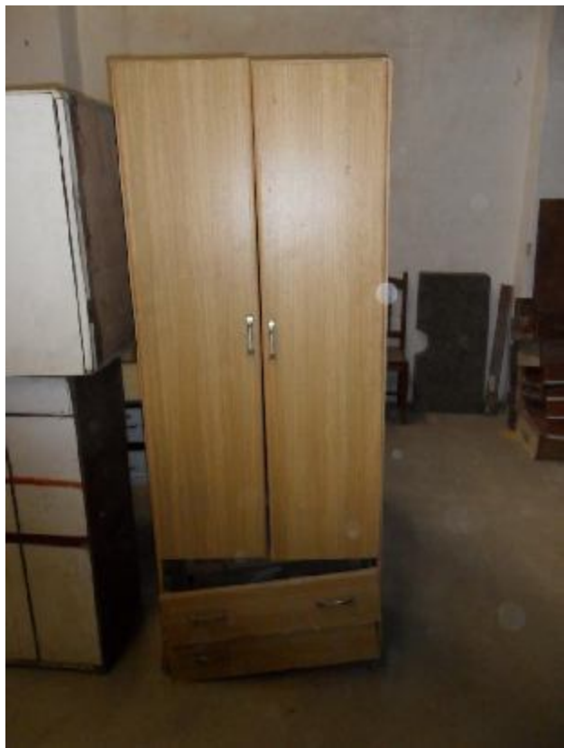
Lote 237 - SEM NÚMERO 035