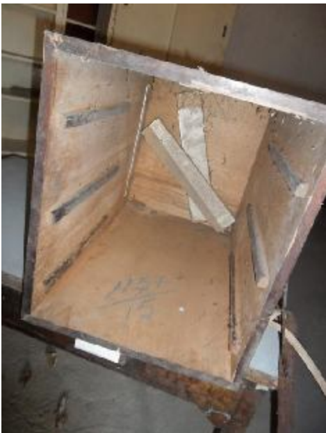
Lote 383 - SEM NÚMERO 182