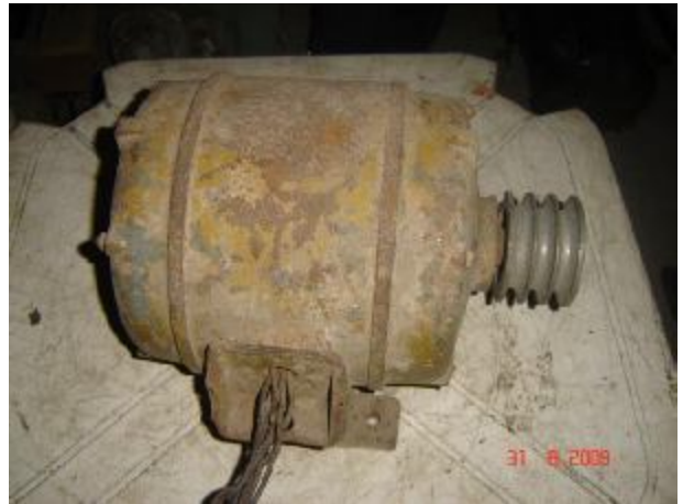
Lote 158 - MOTOR