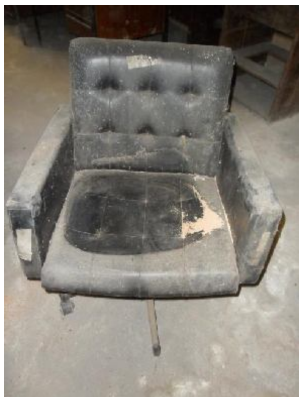
Lote 258 - SEM NÚMERO 056