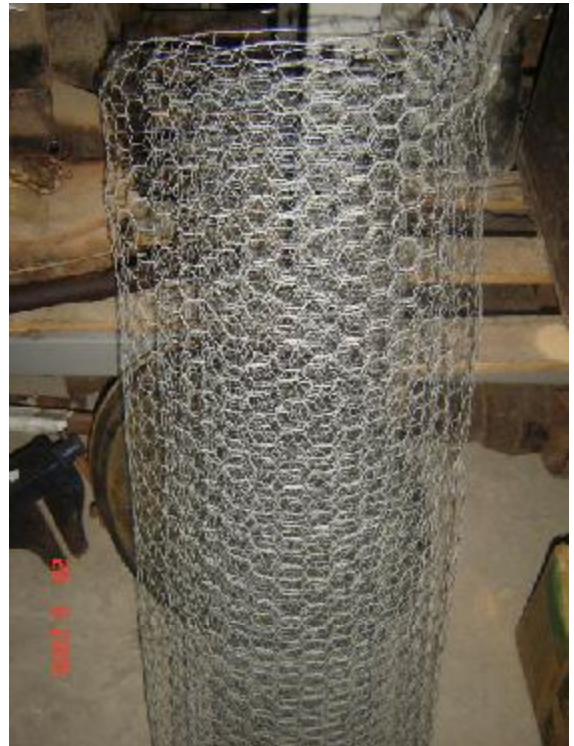
Lote 27 - 01 TELA