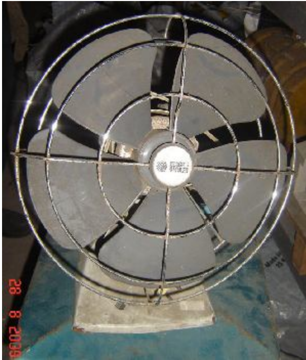
Lote 454 - VENTILADOR