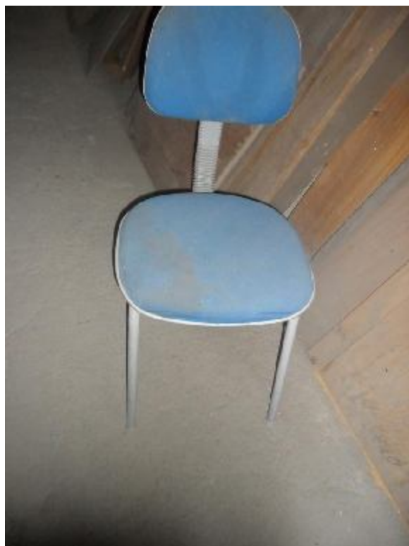
Lote 313 - SEM NÚMERO 111