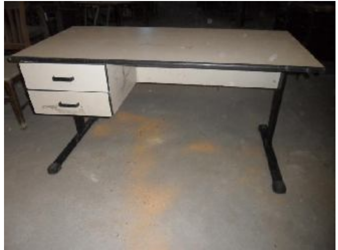
Lote 285 - SEM NÚMERO 83