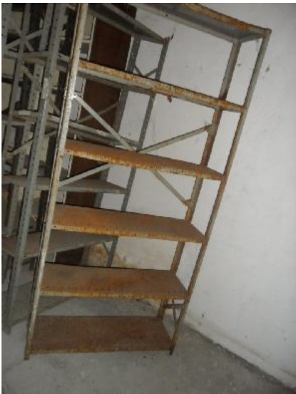
Lote 415 - SEM NÚMERO 215