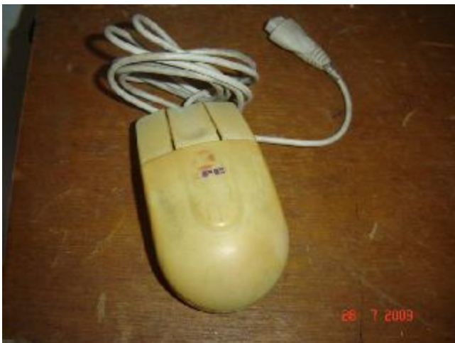
Lote 183 - MOUSE, (XPC)